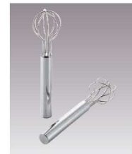
⑯18-8 パイプ柄 味噌取マドラー ページコード 全長 重量 商品コード 価格 2人用 6-0604-1601 φ40×165 50g 1501950 ¥1,300 1人用 6-0604-1602 φ30×160 18g 1501960 ¥670 材質:18-8ステンレススチール ●くると回していくともじ味噌汁の味付けができます。