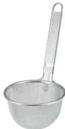
②18-8 プロみそこし (16メッシュ) 切 ページコード 商品コード 価格 6-0604-0201 0217110 ¥3,900 ①170 ②110 ③220 ●引掛付