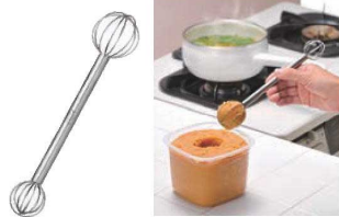
⑮計量みそマドラー 切 ページコード 商品コード 価格 LS1500 6-0604-1501 5040700 ¥1,700 全長:約200 直径:大/φ40 小/φ30 材質:本体/18-8ステンレス 中栓/ナイロン ●大小の丸い計量部を味噌に差してくりと回すと簡単に味噌の計量ができます。 ●毎日の味噌汁が、簡単に一定の味付けで作ることができます。 ●味噌を計量したら、そのまま味噌湯きとして使うことができます。 ●卵湯きや調味料を混ぜる時にも便利に使えます。