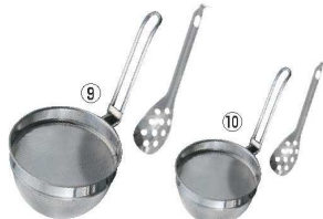
18-8 共柄万能こしセット (レンジ付) ページコード ① ② ③ 商品コード 価格 ⑨大 6-0604-0901 130 90 150 2001401 ¥1,900 ⑩小 6-0604-1001 90 80 140 2001501 ¥1,550 レンジ:18-0ステンレス ●16メッシュ ●引掛付