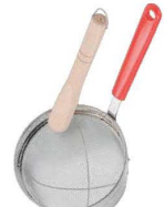
⑧万能こし (すり棒付) ページコード 商品コード 価格 L-0214 6-0604-0801 0701100 ¥1,700 外寸:①125 ②105 ③165 材質:本体/18-8ステンレス ハンドル/ポリプロピレン (耐熱110℃) すり棒/天然木 ●14メッシュ