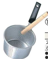
⑬アルマイト PC柄 みそこし (こし棒付) ページコード ① ② ③ 商品コード 価格 大 6-0604-1301 120 80 95 8193800 ¥1,500 小 6-0604-1302 105 85 95 8193900 ¥1,300 ●パンチング穴径:2.5mm ●引掛無