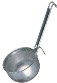
①UK 18-8 パンチング こしテポ ページコード 商品コード 価格 6-0604-0101 7435600 ¥9,000 外寸:①170 ②115 ③245 パンチング穴径:1.1mm ●引掛付