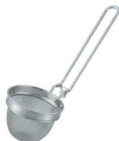
⑭18-8 共柄ミニ味噌こし (14メッシュ) ページコード 商品コード 価格 L-5021 6-0604-1401 0730230 ¥1,100 ①90 ②70 ③170 ●引掛付