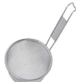
⑦18-8 万能こし (12メッシュ) 洗 ページコード 商品コード 価格 6-0604-0701 2310370 ¥810 ①120 ②83 ③157 材質:18-8ステンレス 【こす】「ゆでる」「水きる」の3役をこなす万能こし器です。