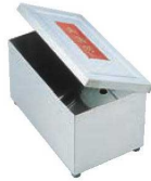
①EBM 電気 のり乾燥器