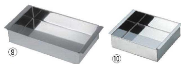
⑨18-8 家庭用 玉子豆腐器