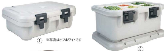
① ※写真はオフホワイトです