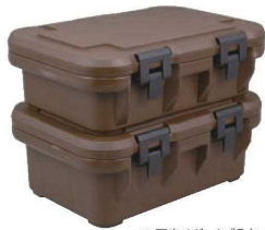
※写真はダークブラウンです