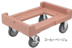
コーヒーベージュ