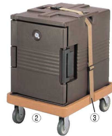
※写真はカムキャリア UPC400のせ、 専用ストラップで 固定した例です。