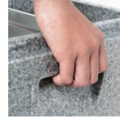
●持ち運びやすい取っ手