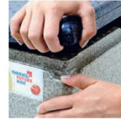
●密閉性の高いフタ

軽量で持ち運びがラクラク。頑丈で耐久性に優れ、衛生的。 高圧縮発泡ポリプロピレン製の保温・保冷ボックス。ディッシュウォッシャーで洗浄可能なので、衛生的。