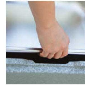
●取り出しやすいスペース