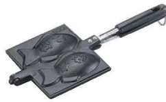
②南部鉄 たいやき 加