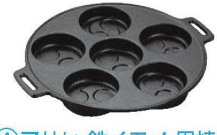
④アサヒ 鉄イモノ 巴焼器 A815-17 加