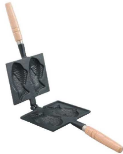
①鉄 たい焼器 418 加