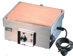
⑥電気ホットプレート