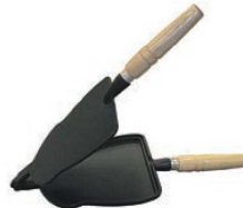
③鉄 いか焼器 加