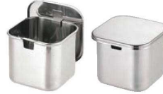
③UK モリブデン 角タレ入