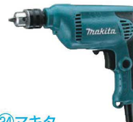
㉔マキタ 電動式ドリル 6412 Ⅱ