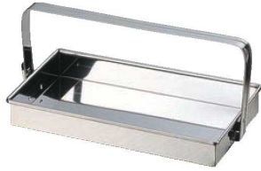
①EBM 18-0 お好み岡持ち