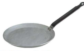
⑤デバイヤー 鉄 共柄 クレーパン 5120