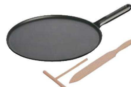
⑧ストーブ クレーパン 30cm 40509-526