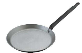
⑥マトファー 鉄 クレーパン