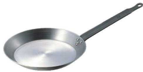
④SW 鉄 クレーパン