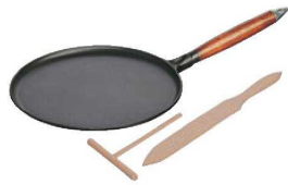
⑦ストーブ クレーパン 木柄 ブラック 28cm 40509-525