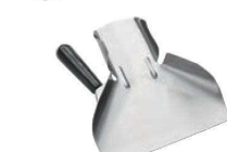
⑪AM ステンレス フレンチフライスクープ 右ハンドル FFSR1