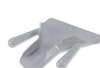
⑬トラエックス フレンチフライスクープ ダブルハンドル 3672