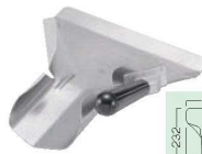
⑩アルミ ポテトスクープ