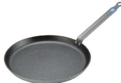
②プジョー アルミニウムスティック クレーパン 6661