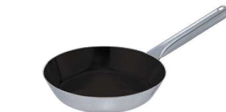
④EBM モリブデンⅡ プラス フライパン