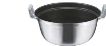
⑤EBM モリブデンⅡ プラス 料理鍋