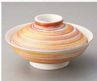
ツ104-019 赤金彩重ね蓋向 φ17.3×9cm(磁)JPN