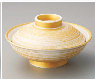
ツ104-029 金彩刷毛巻蓋向 φ17.3×9cm(磁)JPN