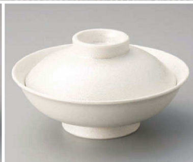
ツ104-039 真珠ラスター蓋向 φ17.3×9cm(磁)JPN