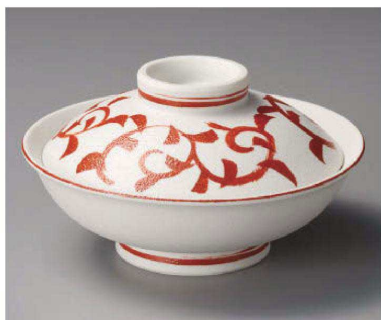
ツ104-049 赤タコ唐草蓋向 φ17.3×9cm(磁)JPN