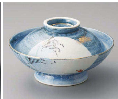
ミ104-069 風月平蓋向 φ16.4×9.3cm(磁)JPN