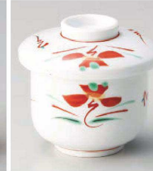
ホ113-109 赤絵花紋むし碗 φ8×9cm (強) JPN 3,800円