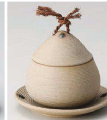
ネ113-319 焼締くり蒸し 大 9×9cm (230cc) (陶) JPN 2,950円 ネ113-329 焼締くり蒸し 大受皿 12×1.5cm (陶) JPN 1,300円