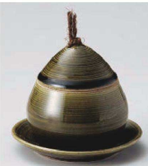
ネ113-279 織部くり蒸 小 φ8.5×8.8cm (150cc) (陶) JPN 2,500円 ネ113-289 織部くり蒸 小皿 φ10.7×1.5cm (陶) JPN 1,250円