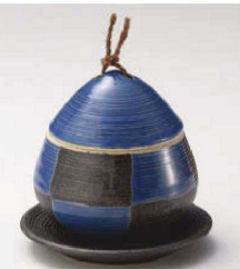
ミ113-249 青市松クリむし碗(大) φ8×8.5cm (200cc) (陶) JPN 2,850円 ミ113-259 青市松クリむし碗(小) φ8×8.5cm (140cc) (陶) JPN 2,450円 ミ113-269 黒いぶし筋彫小皿 φ10.8×1.5cm (陶) JPN 850円