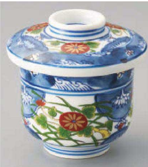
ツ113-039 錦古伊万里むし碗 φ8.4×9cm (強) JPN 4,450円