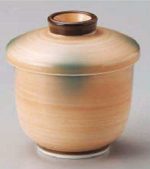
ツ113-079 オレンジ巻グリーン吹京型むし碗 φ7.6×8.5cm (強) JPN 3,900円