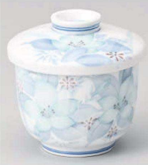
カ113-189 津和野京型むし φ7.5×8.4cm (強) JPN 3,100円