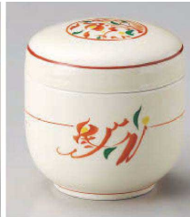
ホ113-049 赤絵みのり夏目むし碗 φ7.8×7.8cm (強) JPN 3,980円