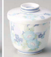
ミ113-209 やすらぎ(強化)むし碗 φ7.7×8.7cm (強) JPN 3,100円