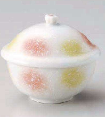
タ113-129 橙黄姫蓋物 9.5×8.3×9.1cm (強) JPN 3,500円