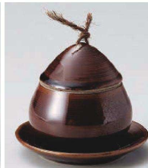
ネ113-299 アメ釉くり蒸 小 φ8.5×8.8cm (150cc) (陶) JPN 2,500円 ネ113-309 アメ釉くり蒸 小皿 φ10.7×1.5cm (陶) JPN 1,250円