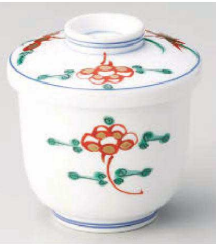
ア113-029 錦宝来むし碗大 φ7.9×9cm・身7.9×7.4cm (強) JPN 4,400円