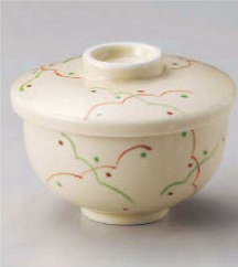
ホ113-089 美濃路大むし碗 φ11×9cm (強) JPN 3,980円