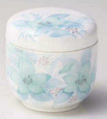
カ113-179 津和野夏目型むし碗 φ8×8cm (強) JPN 3,250円