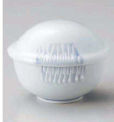
ト113-169 せせらぎ姫むし碗 10.5×9.3×7.3cm (強) JPN 3,200円