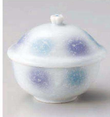
タ113-119 淡青姫蓋物 9.5×8.3×9.1cm (強) JPN 3,500円