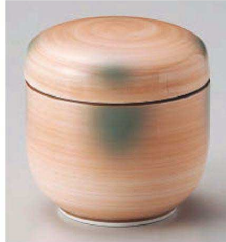
ツ113-069 オレンジ巻グリーン吹夏目型むし碗 φ7.8×7.6cm (強) JPN 4,050円