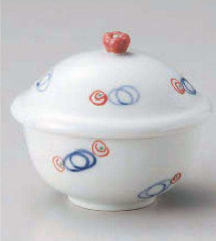
ホ113-139 赤水玉だえんむし碗 9.5×8.2×8.7cm (強) JPN 3,400円