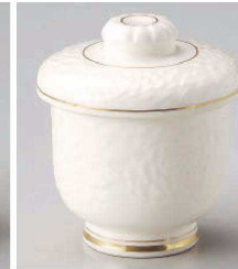
ミ113-059 高麗菊唐草彫むし碗 φ6.8×8.4cm (強) JPN 4,300円