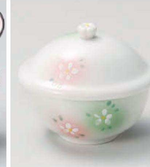
ミ113-159 二色吹小むし碗 9.6×8.3×9cm (強) JPN 3,100円