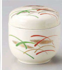
オ113-099 武蔵野夏目むし碗 φ7.7×8cm (強) JPN 3,850円