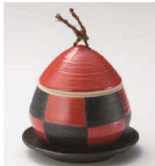
ミ113-219 赤市松クリむし碗(大) φ8×8.5cm (205cc) (陶) JPN 2,850円 ミ113-229 赤市松クリむし碗(小) φ9×9cm (140cc) (陶) JPN 2,450円 ミ113-239 黒いぶし筋彫小皿 φ10.8×1.5cm (陶) JPN 850円