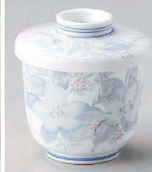
カ113-199 津和野むし碗 φ8×9.5cm (強) JPN 3,100円