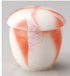
ツ113-019 銀彩ねじりむし碗(大) φ8.3×8.5cm (強) JPN 4,600円