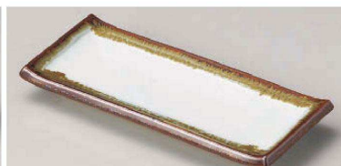
オ129-129 白天目流し突出皿 23×9.8×2.5cm(陶)JPN