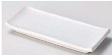
ト129-059 白雪突出皿 22.5×9.5×3cm(陶)JPN