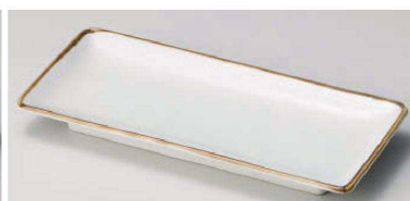
イ129-159 茶淵波淵付皿 20.3×9×2.3cm(陶)JPN