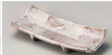
口129-069 手造り風志野足付付皿 22.8×10×4cm(陶)JPN