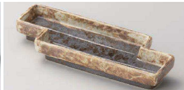
キ129-039 黒伊賀かいらぎハッ橋突出皿 24.5×9.2×3.7cm(陶)JPN