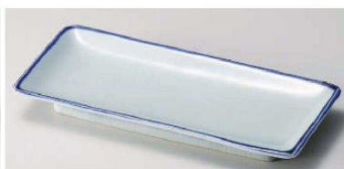
イ129-149 おぶけ波淵付皿 20.3×9×2.3cm(陶)JPN