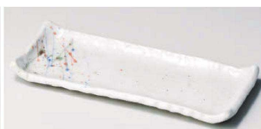
口129-179 はるかぜ 付皿 24.7×10×2.2cm(陶)JPN