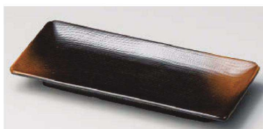
イ129-139 やきしめ波淵付皿 20.3×9×2.3cm(陶)JPN