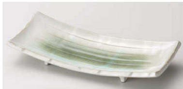
口129-049 新緑反突出皿 22×9.7cm(陶)JPN