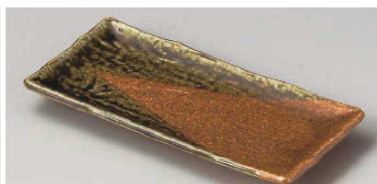
タ129-119 美濃伊賀串皿 19.7×9.4×2cm(陶)JPN