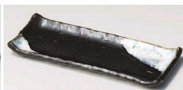
口129-189 融雪 付皿 24.6×9.6×2.3cm(陶)JPN