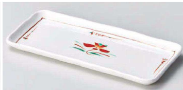
ホ129-029 赤絵花紋突出皿 20.5×9cm(陶)JPN