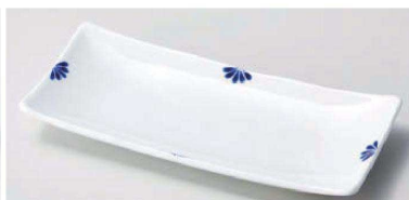
口129-089 小花(青)突出皿 22×10×2.7cm(陶)JPN