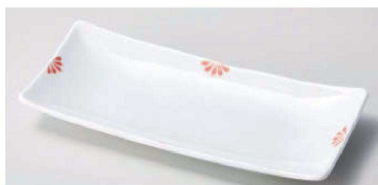
口129-079 小花(赤)突出皿 22×10×2.7cm(陶)JPN