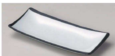
ホ129-169 桃山突出皿 22.5×10cm(陶)JPN