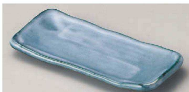
口129-109 よもぎ突出皿 21×9.5×2.5cm(陶)JPN