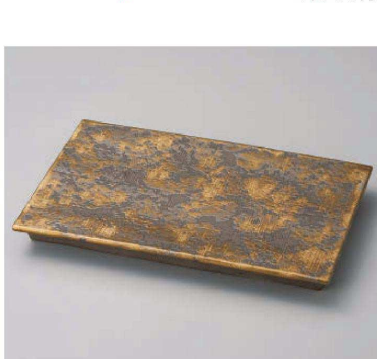
オ159-149 GOLDルール皿 大 31×19.8×3cm (陶) JPN 7,500円