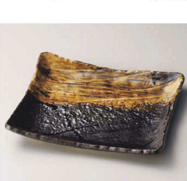
ネ159-139 流木角大皿 30.5×24.5×5cm (磁) JPN 7,500円