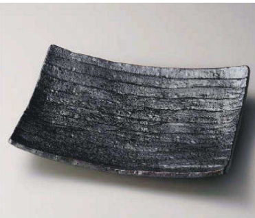
カ159-029 南蛮長角盛皿(大) 35×27.3×5cm (磁) JPN 9,350円