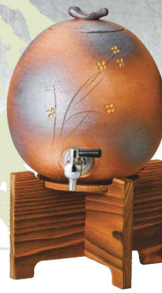
×264-039 火色小花サーバー 23×19.5×34cm (3000cc) (陶) (信楽焼) JPN 27,500円