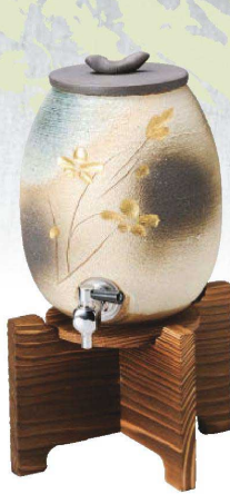
×264-019 金彩花彫サーバー 21.5×16×35cm (2200cc) (陶) (信楽焼) JPN 27,500円