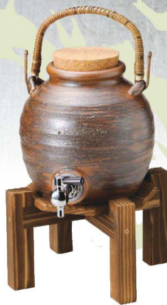
×264-029 灰釉手付サーバー (マイナスイオン) 20×15×37cm (2500cc) (陶) (信楽焼) JPN 24,000円