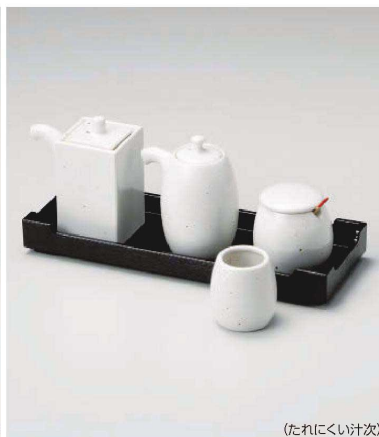
ミ283-229 白備前 角ソース φ4.8×9.5cm (陶) JPN 2,600円 ミ283-239 白備前 なつめ醤油差し φ3.2×9.2cm (陶) JPN 2,480円 ミ283-249 白備前 辛子入 φ4×5.8cm (陶) JPN 1,980円 ミ283-259 竹さじ 7.7cm JPN 320円 ミ283-269 白備前 楊枝入 φ3.2×5cm (陶) JPN 1,300円 ミ283-279 黒 カスター一盆 23×8.5×3cm JPN 1,600円