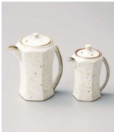
ツ283-019 粉引青磁たれポット 14×9.5×16cm(400cc) (陶) JPN 5,000円 ツ283-029 粉引青磁手付汁次(大) 11.5×7.5×13.5cm (陶) JPN 4,000円