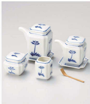
チ283-059 間取花汁次(大)皿付 9.5×6×9cm(200cc) (陶) JPN 4,700円 チ283-069 間取花汁次(小)皿付 8.4×5.7×7.8cm(140cc) (陶) JPN 4,000円 チ283-079 間取花辛子入 5.6×5.4cm (陶) JPN 2,600円 ワ283-089 すず竹薬味スプーン 7.8×1cm (木) CHN 370円 チ283-099 間取花楊枝入 4.3×5.3cm (陶) JPN 2,000円