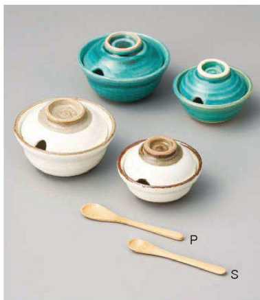
ユ283-109 トルコ口切やくみ入れ(大) φ9.5×8.3cm (陶) JPN 3,000円 ユ283-119 トルコ口切やくみ入れ(小) φ8×5.5cm (陶) JPN 2,500円 ユ283-129 粉引口切やくみ入れ(大) φ9.5×8.3cm (陶) JPN 3,000円 ワ283-139 竹スプーン(P) 薬味用 10×1.8cm (木) CHN 430円 ユ283-149 粉引口切やくみ入れ(小) φ8×5.5cm (陶) JPN 2,500円 ワ283-159 竹スプーン(S) 薬味用 9×1.4cm (木) CHN 430円