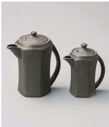
ツ283-039 黒備前風たれポット 14×9.5×16cm(400cc) (陶) JPN 5,000円 ツ283-049 黒備前風手付汁次(大) 11.5×7.5×13.5cm (陶) JPN 4,000円