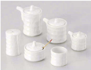
タ285-379 白磁つづみ汁次大φ5.9×9.2cm(150cc) (陶)JPN 2,200円 タ285-389 白磁つづみ汁次小φ6×7.3cm(100cc) (陶)JPN 2,000円 タ285-399 白磁つづみ辛子入φ6.1×4.5cm (陶)JPN 1,900円 タ285-409 白磁つづみふりかきφ4×7cm (陶)JPN 1,700円 タ285-419 白磁つづみミニ汁次φ4.5×5.5cm(50cc) (陶)JPN 1,500円 タ285-429 白磁つづみ楊枝入φ4.5×3.9cm (陶)JPN 900円 タ285-439 薬味スプーン8cm(木)CHN(木製) 300円