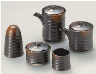
ト285-239 焼締汁次(大)φ6.4×10.2cm(200cc) (陶)JPN 2,200円 ト285-249 焼締汁次(小)φ6.4×8.2cm(130cc) (陶)JPN 2,000円 ト285-259 焼締辛子入φ6.5×5.7cm (陶)JPN 1,900円 ト285-269 焼締塩入φ5.2×8.2cm (陶)JPN 1,650円 ト285-279 焼締楊枝入φ4.9×4.4cm (陶)JPN 1,000円