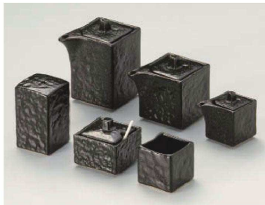
□285-019 瀬戸黒四角汁次(大)9.5×6×9cm(200cc) (陶)JPN 2,360円 □285-029 瀬戸黒四角汁次(小)9×6×7cm(140cc) (陶)JPN 2,180円 □285-039 瀬戸黒四角汁次(ミニ)6.3×4×5.5cm(50cc) (陶)JPN 1,680円 □285-049 瀬戸黒四角カラシ入5.5×5.5×5cm (陶)JPN 2,130円 □285-059 瀬戸黒四角一ツ穴4.5×4.5×7.5cm (陶)JPN 1,820円 □285-069 瀬戸黒四角楊子入4.5×4.5×4.5cm (陶)JPN 1,000円