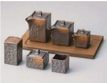
□285-119 焼締四角汁次(大)9.5×6×9cm(200cc) (陶)JPN 2,360円 □285-129 焼締四角汁次(小)9×6×7cm(140cc) (陶)JPN 2,180円 □285-139 焼締四角汁次(ミニ)6.3×4×5.5cm(50cc) (陶)JPN 1,680円 □285-149 焼締四角一ツ穴4.5×4.5×7.5cm (陶)JPN 1,820円 □285-159 焼締四角カラシ入5.5×5.5×5cm (陶)JPN 2,130円 □285-169 焼締四角楊子入4.5×4.5×4.5cm (陶)JPN 1,000円 □285-179 焼杉カスター一盆25.2×14.5×1.9cm(木)JPN 2,150円