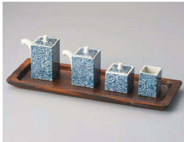
ヨ285-189 タコ唐草 角ソース入8×5×9cm(140cc) (陶)JPN 2,400円 ヨ285-199 タコ唐草 角醤油入7.5×4.7×8cm(100cc) (陶)JPN 2,400円 ヨ285-209 タコ唐草 角辛子入4.8×4.8×5cm (陶)JPN 2,000円 ヨ285-219 タコ唐草 角楊枝入3.7×3.7×5cm (陶)JPN 1,400円 ヨ285-229 焼木白長角トレー35×12×H2.3cm(木)CHN 1,300円