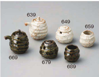
ヨ285-639 サビ志野手びねり醤油φ6.3×8cm(135cc) (陶)JPN 1,900円 ヨ285-649 サビ志野手びねり辛子φ6.3×5.5cm (陶)JPN 1,600円 ヨ285-659 サビ志野手びねり楊枝φ5×4.7cm (陶)JPN 1,100円 ヨ285-669 深緑手びねり醤油φ6.3×8cm(135cc) (陶)JPN 1,900円 ヨ285-679 深緑手びねり辛子φ6.3×5.5cm (陶)JPN 1,600円 ヨ285-689 深緑手びねり楊枝φ5×4.7cm (陶)JPN 1,100円