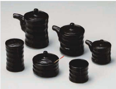
タ285-449 瀬戸黒つづみ汁次大φ3×6×9.7cm(130cc) (陶)JPN 2,200円 タ285-459 瀬戸黒つづみ汁次小φ4×6×7.8cm(100cc) (陶)JPN 2,000円 タ285-469 瀬戸黒つづみ辛子入φ6×5.5cm (陶)JPN 1,900円 タ285-479 瀬戸黒つづみふりかきφ4.3×7cm (陶)JPN 1,700円 タ285-489 瀬戸黒つづみミニ汁次φ5×4.5×5.1cm(50cc) (陶)JPN 1,500円 タ285-499 瀬戸黒楊枝入φ4.5×4cm (陶)JPN 900円 タ285-509 薬味スプーン8cm(木)CHN 300円