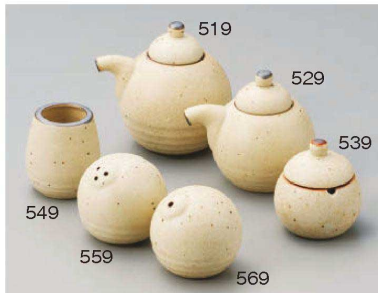
ハ285-519 白唐津 汁次大9.5×9.3cm(200cc) (陶)JPN 2,200円 ハ285-529 白唐津 汁次小8.5×8cm(120cc) (陶)JPN 1,950円 ハ285-539 白唐津 薬味入φ5.5×6.3cm (陶)JPN 1,600円 ハ285-549 白唐津 楊枝入φ5×5.5cm (陶)JPN 1,100円 ハ285-559 白唐津 胡椒入φ5.5×5.5cm (陶)JPN 1,400円 ハ285-569 白唐津 塩入φ5.5×5.5cm (陶)JPN 1,400円