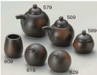
ハ285-579 備前汁次大9.5×9.3cm(200cc) (陶)JPN 2,200円 ハ285-589 備前汁次小8.5×8cm(120cc) (陶)JPN 1,950円 ハ285-599 備前薬味入φ5.4×5.6cm (陶)JPN 1,600円 ハ285-609 備前楊枝入φ4.5×5.3cm (陶)JPN 1,100円 ハ285-619 備前胡椒入φ5.7×5.5cm (陶)JPN 1,400円 ハ285-629 備前塩入φ5.7×5.5cm (陶)JPN 1,400円