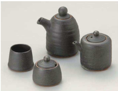
ㄥ285-079 錆黒汁次(大)約250cc(陶)JPN 2,980円 ㄥ285-089 錆黒汁次(小)約160cc(陶)JPN 2,480円 ㄥ285-099 錆黒辛子入4.5×5.5cm(陶)JPN 1,950円 ㄥ285-109 錆黒楊子入4×4.5cm(陶)JPN 1,450円