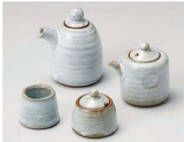
ツ285-339 灰釉汁次(大)φ8.5×10.5cm(250cc) (陶)JPN 2,650円 ツ285-349 灰釉汁次(小)φ8.2×8.5cm(150cc) (陶)JPN 2,200円 ツ285-359 灰釉辛子入6×5.5cm (陶)JPN 1,700円 ツ285-369 灰釉楊子入4×5.5×4.5cm (陶)JPN 1,250円