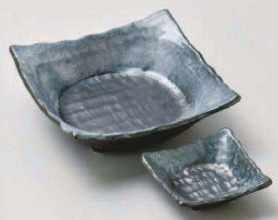
ツ031-119 黒志野四ツ足刺身鉢 15.5×15.5×5.5cm (磁) JPN 1,800円 ツ031-129 黒志野四ツ足千代口 8.5×8.5×3cm (磁) JPN 950円