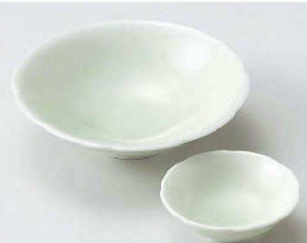
イ031-199 もえぎ輪花方向付 φ15×4.2cm (磁) JPN 1,700円 イ031-209 もえぎ千代口 φ8.5×3cm (磁) JPN 680円