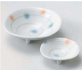
ア031-059 風車三ツ足刺身鉢 φ15.5×4.5cm (磁) JPN 2,000円 ア031-069 風車三ツ足3.0鉢 φ10×3cm (磁) JPN 850円