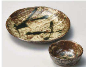
コ031-179 カイラギ織部散し 5.5皿 φ16.5×2.8cm (磁) JPN 1,680円 コ031-189 カイラギ織部散し 波千代口 φ8.2×3.2cm (磁) JPN 880円