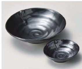
イ031-019 鉄結晶翔大鉢 17.5×16×5.2cm (磁) JPN 2,000円 イ031-029 鉄結晶翔千代口 9.8×8.6×3.3cm (磁) JPN 900円