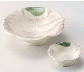
ホ031-039 粉引織部流方向付 φ15.2×4.5cm (磁) JPN 1,980円 ホ031-049 粉引織部流千代口 φ8×2.5cm (磁) JPN 720円