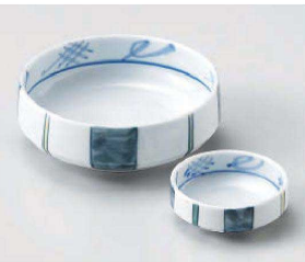
ア031-079 四方十草刺身鉢 φ13.5×5cm (磁) JPN 2,050円 ア031-089 四方十草丸千代口 φ7.8×3cm (磁) JPN 1,050円