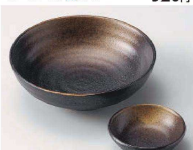
イ031-379 黒備前ボール大 φ15×4.5cm (磁) JPN 1,000円 イ031-389 黒備前千代口 φ8×2.5cm (磁) JPN 900円