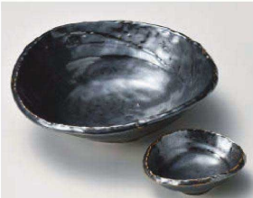
イ031-219 鉄結晶扇中鉢 17.5×16.5×5.4cm (磁) JPN 1,700円 イ031-229 鉄結晶扇千代口 8.4×7.3×3.1cm (磁) JPN 900円