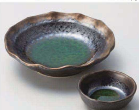
ホ031-279 いぶし金彩織部花型5.0鉢 φ17×4.3cm (磁) JPN 1,680円 ホ031-289 いぶし金彩織部丸千代口 φ8.2×3cm (磁) JPN 700円