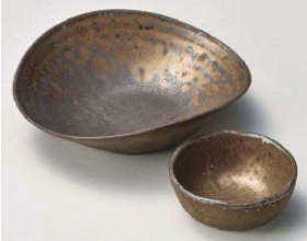
コ031-139 金結晶 楕円方向付 16×15×5cm (磁) JPN 1,780円 コ031-149 金結晶 波千代口 φ8.2×3.6cm (磁) JPN 800円