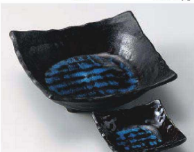
ア031-299 深海四ツ足角刺身鉢 15×15×5cm (磁) JPN 1,750円 ア031-309 深海四ツ足角千代口 8.2×8.2×3cm (磁) JPN 920円