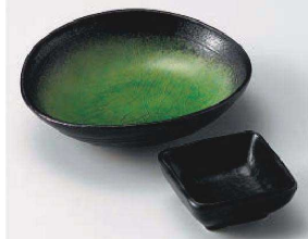
ホ031-099 有明変形刺身鉢 16×15×4.5cm (磁) JPN 1,980円 ホ031-109 有明黒千代口 7.5×7.5×3.2cm (磁) JPN 900円