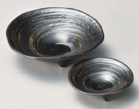
キ031-159 黒渦 三ツ足方向付 φ15.5×4.7cm (磁) JPN 1,760円 キ031-169 黒渦 三ツ足千代口 φ9.9×3cm (磁) JPN 800円