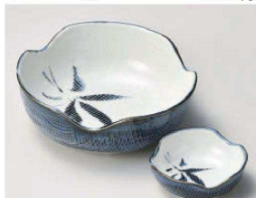
ヤ031-259 古染布目笹刺身鉢 15.7×6cm (磁) JPN 1,900円 ヤ031-269 古染布目笹丸千代口 8.2×3cm (磁) JPN 780円