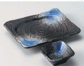
ア031-319 渦潮刺身皿 18.2×14.7×2.7cm (磁) JPN 1,250円 ア031-329 渦潮角千代口 8×8×3.3cm (磁) JPN 600円