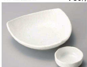
コ031-339 粉引三角鉢 17×16.5×4.8cm (磁) JPN 1,350円 コ031-349 粉引丸千代口 φ7.1×2.8cm (磁) JPN 480円