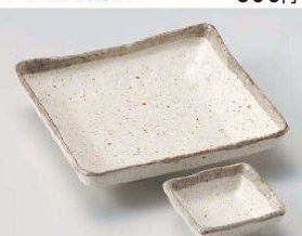
ミ031-399 白唐津深口正角皿 16.7×16.7×3.8cm (磁) JPN 1,050円 ミ031-409 白唐津深口正角千代口 7.3×7.3×3cm (磁) JPN 450円