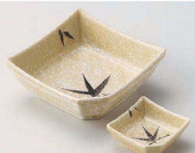
ヤ031-239 石焼織部笹刺身井 14.4×14.4cm (磁) JPN 1,800円 ヤ031-249 石焼織部笹深口千代口 7.3×7.3cm (磁) JPN 780円