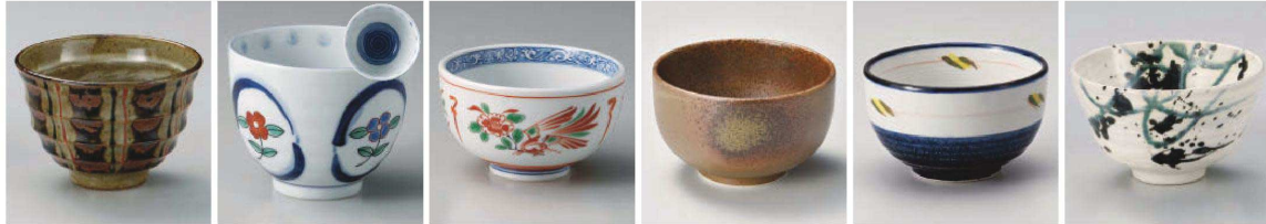
ミ333-079 益子錆十草4.2深丼 φ12.5×9.5cm (陶) JPN 2,300円 ミ333-089 錦花紋おしゃれ碗 10.7×8.5cm (磁) JPN 2,250円 イ333-099 花鳥小丼 φ11.3×6.6cm (陶) JPN 2,200円 ツ333-109 備前風4.0小丼 φ12.5×7.5cm (強) JPN 2,200円 ツ333-119 たんざく紋4.0夏目丼 φ12×7.2cm (強) JPN 2,300円 ミ333-129 粉引墨吹4.5丼 φ12×8cm (磁) JPN 2,180円