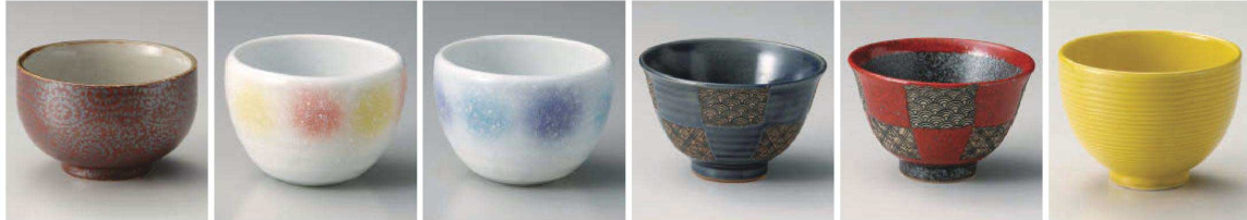
ミ333-199 赤染夕コ唐草4.0多用丼 φ12.8×7.8cm (陶) JPN 2,300円 タ333-209 橙黄姫丼 φ10.7×7.6cm (磁) JPN 2,000円 タ333-219 淡青姫丼 φ10.7×7.6cm (磁) JPN 2,000円 オ333-229 藍市松青海波反4.0丼 φ12.5×7.7cm (陶) JPN 2,300円 オ333-239 赤市松青海波反4.0丼 φ12.5×7.7cm (陶) JPN 2,300円 ミ333-249 黄交跡袖干段姫丼(大) φ11.5×8cm (陶) JPN 2,500円