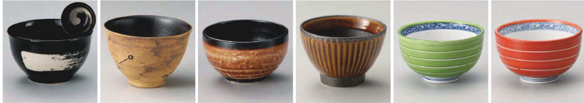
ロ333-319 アメなごみ丼(小) φ12.7×7.2cm (磁) JPN 1,980円 ミ333-329 織部刷毛ちらし小丼 φ12.5×7.3cm (磁) JPN 1,980円 ホ333-339 織部なごみ丼(小) φ12.7×7.2cm (磁) JPN 1,980円 ロ333-349 白釉錆刷毛多用碗 φ12.7×7.5cm (磁) JPN 1,980円 ロ333-359 黒釉白刷毛多用碗 φ12.7×7.5cm (磁) JPN 1,980円 ミ333-369 黒釉焼締姫丼 φ11.5×11.8cm (陶) JPN 2,350円