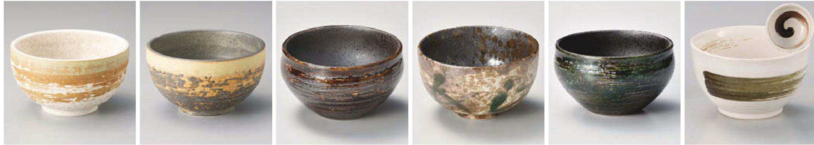
オ333-259 疾風中丼 φ13×7.2cm (陶) JPN 2,000円 オ333-269 流夢小丼 φ12.4×7.2cm (陶) JPN 1,650円 オ333-279 疾風お好み小丼 φ11.1×6.4cm (陶) JPN 1,350円 オ333-289 流夢中丼 φ13×7.2cm (陶) JPN 2,000円 オ333-299 疾風小丼 φ12.4×7.2cm (陶) JPN 1,650円 オ333-309 疾風お好み小丼 φ11.1×6.4cm (陶) JPN 1,350円