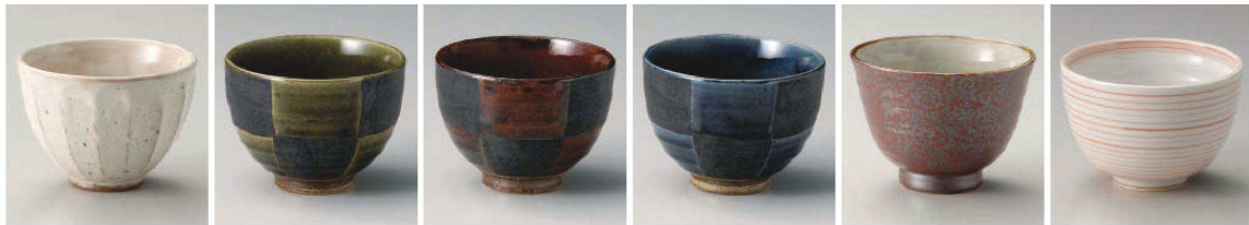
イ333-019 粉引面取姫丼 φ11.3×8.2cm (陶) JPN 2,300円 ミ333-029 織部市松姫丼 φ11.3×8.3cm (陶) JPN 2,350円 ミ333-039 アメ軸市松姫丼 φ11.3×8.3cm (陶) JPN 2,350円 ミ333-049 藍市松夏目姫丼 φ11.3×8cm (陶) JPN 2,350円 ミ333-059 赤染夕コ唐草4.3多用碗 φ13×9.5cm (陶) JPN 2,550円 ミ333-069 朱干段小丼 φ12×8cm (磁) JPN 2,300円