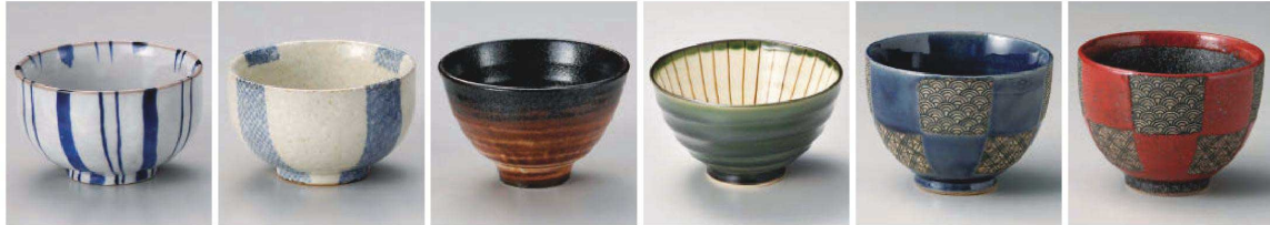
ミ333-139 粉引ゴス十草4.2丼 φ12.5×7.5cm (陶) JPN 2,200円 ミ333-149 白砂波鹿の子4.5丼 φ12.5×7.5cm (陶) JPN 2,200円 オ333-159 志野化粧けずり茶漬け丼 φ13.2×8.4cm (磁) JPN 2,350円 ロ333-169 織部楯目特大飯碗 φ13×7.5cm (陶) JPN 2,300円 オ333-179 藍市松青海波姫丼(大) φ11.5×8.5cm (陶) JPN 2,550円 オ333-189 赤市松青海波姫丼(大) φ11.5×8.5cm (陶) JPN 2,550円