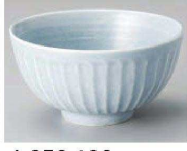
ヤ350-189 灰マットブルー削茶碗 (大) φ12.5×6.5cm (陶) JPN 1,100円