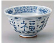
ト350-309 福福大平 φ12.7×7cm (陶) JPN 1,100円 ト350-319 福福中平 φ11.5×6.3cm (陶) JPN 900円