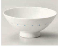
口350-259 千段水玉 茶碗 φ12×5.3cm (陶) JPN 1,090円