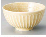
ヤ350-199 おふけ黄削茶碗 (大) φ12.5×6.5cm (陶) JPN 1,100円