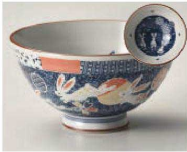
イ350-329 花ゆめうさぎ 毛料 φ14.2×6.3cm (陶) JPN 1,100円 イ350-339 花ゆめうさぎ 大平 φ12.5×6.2cm (陶) JPN 900円