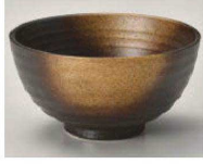
ヤ350-469 金茶吹 六兵衛丸碗 大 φ12.3×6.5cm (陶) JPN 1,200円 ヤ350-479 金茶吹 六兵衛丸碗 小 φ11.3×6cm (陶) JPN 1,000円