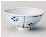
口350-059 梨地市松梅中平 φ11.7×5.5cm (陶) JPN 1,280円