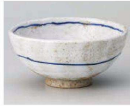
口350-559 ゆきみち大平 φ12.5×5.8cm (陶) JPN 1,080円 口350-569 ゆきみち中平 φ11.5×5.2cm (陶) JPN 1,020円

表示価格、仕様などは予告なく変更となる場合があります。最新情報はWEBサイトにて必ずご確認ください(廃番含)。