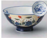
イ350-409 フクロブルー毛料 φ14.3×6.3cm (陶) JPN 1,100円 イ350-419 フクロブルー大平 φ12.5×5.9cm (陶) JPN 900円