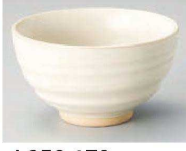
カ350-179 白マット六兵衛茶碗 φ11.2×6.5cm (陶) JPN 1,200円