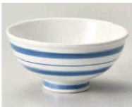
口350-029 親子駒筋中平 φ11.5×5.6cm (陶) JPN 1,210円