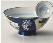
イ350-369 福おいで 毛料 φ14.2×6.3cm (陶) JPN 1,100円 イ350-379 福おいで 大平 φ12.5×6.2cm (陶) JPN 900円