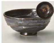
ト350-019 黒金 飯碗 φ12.5×5.5cm (陶) JPN 1,200円