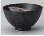
イ350-249 黒備前白刷毛ソング飯碗 φ11.8×6.6cm (陶) JPN 1,100円