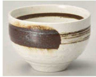
ホ350-509 サビ刷毛陶碗 φ10×6.8cm (陶) JPN 1,050円