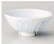
口350-069 間取り渦水切り浜中平 φ11.7×5.5cm (陶) JPN 1,280円