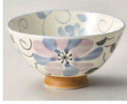
イ350-269 ハスイフラワー 毛料 φ14.2×6.3cm (陶) JPN 1,100円 イ350-279 ハスイフラワー 大平 φ12.5×6.2cm (陶) JPN 900円