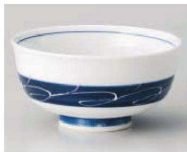
ア350-049 白波帯汁茶碗 φ11.9×6cm (陶) JPN 1,200円