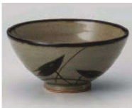
ミ350-039 益子水草中平 φ11.6×5.8cm (陶) JPN 1,180円