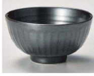
イ350-489 鉄結晶削ぎ茶碗 (小) φ11.5×6.1cm (陶) JPN 1,100円