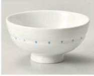
口350-089 千段水玉 丸茶碗 φ11.6×5.8cm (陶) JPN 1,130円