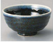
イ350-449 アイ灰釉流し茶碗 φ11×5.7cm (陶) JPN 1,050円