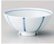
口350-549 一珍八本十草水切り浜中平 φ11.7×5.5cm (陶) JPN 1,080円