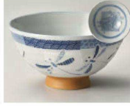
イ350-289 市松毛料 φ14.2×6.3cm (陶) JPN 1,100円 イ350-299 市松 大平 φ12.5×6.2cm (陶) JPN 900円