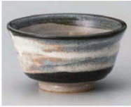
ア350-519 雲姫丼 φ12×6.4cm (陶) JPN 1,100円