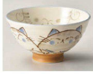
イ350-429 ミケ 毛料 φ14.2×6.3cm (陶) JPN 1,100円 イ350-439 ミケ 大平 φ12.5×6.1cm (陶) JPN 900円