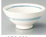
ツ350-209 白川志野中平 φ12×6cm (陶) JPN 1,300円