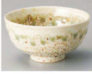
イ350-459 白砂地灰釉流し茶碗 φ11×5.7cm (陶) JPN 1,050円