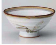
カ350-149 白天目麦大平 φ12.5×6cm (陶) JPN 1,150円