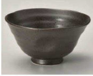
ホ350-099 黒茶スマート茶碗 (大) φ11.6×6cm (陶) JPN 1,100円 ホ350-109 黒茶スマート茶碗 (小) φ10.5×5.2cm (陶) JPN 950円