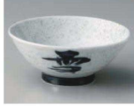
ツ350-219 雪月花新型4.5丸 丼 φ13.8×5.8cm (陶) JPN 1,000円