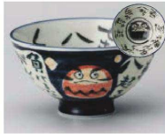
イ350-389 ダルマブルー毛料 φ14.3×6.3cm (陶) JPN 1,100円 イ350-399 ダルマブルー大平 φ12.5×6.6cm (陶) JPN 900円