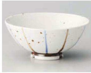
口350-539 斑点十草中平 φ11.7×5.5cm (陶) JPN 1,350円