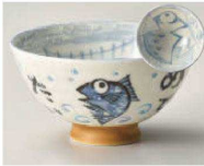
イ350-349 タイ ブルー毛料 φ14.3×6.3cm (陶) JPN 1,100円 イ350-359 タイ ブルー大平 φ12.5×5.9cm (陶) JPN 900円