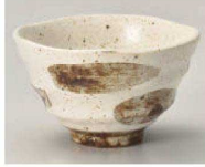
ユ350-139 茶刷毛 茶碗 φ11.5×6.8cm (陶) JPN 1,250円