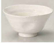
ホ350-119 白粉引スマート茶碗 (大) φ11.6×6cm (陶) JPN 1,100円 ホ350-129 白粉引スマート茶碗 (小) φ10.5×5.2cm (陶) JPN 950円