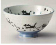
イ350-229 さんぼネコ 毛料 φ14.2×6.3cm (陶) JPN 1,100円 イ350-239 さんぼネコ 大平 φ12.5×6.2cm (陶) JPN 900円