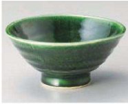
ミ350-529 流水織部茶碗 12.5×6cm (陶) JPN 1,200円