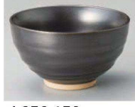
カ350-159 鉄結晶六兵衛茶碗 φ11.2×6.5cm (陶) JPN 1,200円