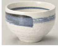
ホ350-499 ゴス刷毛陶碗 φ10×6.8cm (陶) JPN 1,050円