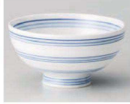
口350-079 三段帯筋丸茶碗 φ11.5×5.9cm (陶) JPN 1,130円