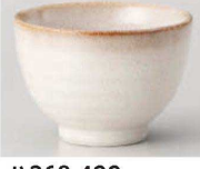
H368-429 粉引煎茶 φ8.3×5.4cm (150cc) (藍) JPN 620円

表示価格、仕様などは予告なく変更となる場合があります。最新情報はWEBサイトにて必ずご確認ください(廃番含)。