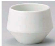
H368-019 フラスダム(ホワイト)煎茶 8.1×6.2cm (藍) JPN 3,850円