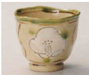
O368-039 白格子花たつぷり碗 φ9.3×8.3cm (陶) JPN 3,000円