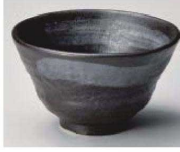
M368-209 黒銀河もえぎ3.0煎茶 9.5×5.5cm (藍) JPN 1,450円