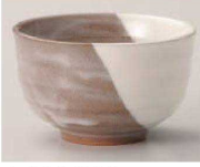
T368-299 粉引塗分け六兵衛煎茶 φ8.7×5.4cm (170cc) (陶) JPN 700円