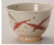
X368-079 赤絵汲出し φ10×7.5cm (250cc) (陶) (徳楽焼) JPN 2,150円