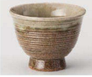
U368-189 美濃伊賀千段高台煎茶 φ9×7cm (180cc) (陶) JPN 1,590円