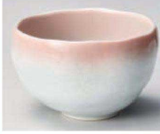
H368-159 ピンク吹ゆらぎ大煎茶 φ9.8×6cm (280cc) (藍) JPN 1,700円