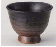
U368-169 備前黒吹高台煎茶 φ9×7cm (190cc) (陶) JPN 1,480円