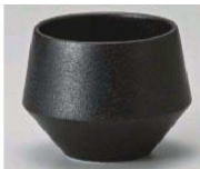
H368-029 フラスダム(ブラック)煎茶 8.1×6.2cm (藍) JPN 3,850円