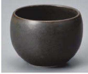
I368-099 くつろぎ鉄黒 玉千茶 φ7×5.2cm (120cc) (藍) JPN 1,700円