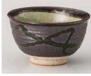
N368-269 黒砂煎茶 φ9.3×5.2cm (180cc) (陶) JPN 1,250円