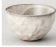
K368-259 白流粉引丸煎茶 φ10×5.8cm (240cc) (陶) JPN 1,270円