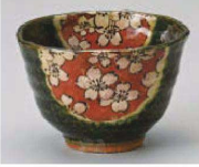
K368-129 織部舞桜煎茶 φ9.5×6.4cm (220cc) (陶) JPN 1,600円