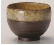
I368-149 黒土かいらぎ黄煎茶 φ8.7×7cm (250cc) (陶) JPN 1,600円