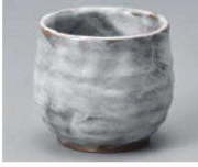
T368-229 黒志野玉湯呑 φ7×6.5cm (110cc) (陶) JPN 1,300円