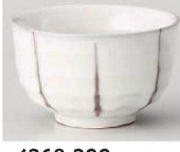
I368-399 京十草煎茶 φ8.5×5.4cm (160cc) (陶) JPN 780円