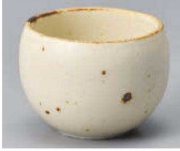
I368-109 くつろぎ粉引 玉千茶 φ7×5.2cm (120cc) (藍) JPN 1,700円