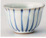
H368-289 呉須十草反煎茶 φ8.8×6cm (160cc) (陶) JPN 1,200円