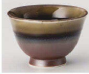
A368-089 南蛮織部反煎茶 φ9.1×6cm (170cc) (赤) JPN 2,000円