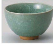
H368-319 ヒワもえぎ貫入煎茶 φ9.3×5.7cm (180cc) (陶) JPN 950円