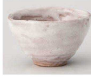
K368-199 手造り風志野変型煎茶 9.6×9×5.7cm (140cc) (陶) JPN 1,800円