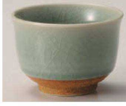
I368-329 青磁貫入 反煎茶 φ8.5×6cm (150cc) (陶) JPN 750円