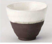
K368-249 黒陶塗分小湯呑 φ8.6×7cm (170cc) (陶) JPN 1,270円