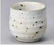
T368-239 粉引青磁玉湯呑 φ7×6.5cm (110cc) (陶) JPN 1,300円