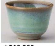
H368-389 新ヒワグリーン反煎茶 φ8.3×6.1cm (140cc) (陶) JPN 730円