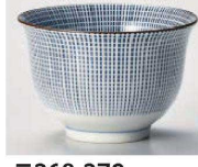
T368-379 千段十草 煎茶 φ9.1×6cm (180cc) (藍) JPN 700円