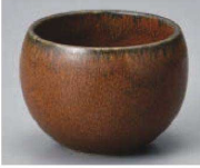
I368-119 くつろぎアメ 玉千茶 φ7×5.2cm (120cc) (藍) JPN 1,700円