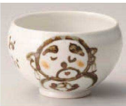
M368-069 粉引地藏陶碗 10.2×6.7cm (310cc) (陶) JPN 2,650円