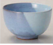
T368-309 均窯塗分け京煎茶 φ8.5×5.3cm (170cc) (陶) JPN 700円