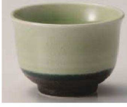
I368-339 若草貫入 反煎茶 φ8.5×6cm (150cc) (陶) JPN 750円