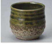
T368-219 伊賀織部玉湯呑 φ7×6.5cm (110cc) (陶) JPN 1,300円