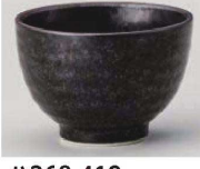
H368-419 黒水晶煎茶 φ8.3×5.4cm (150cc) (陶) JPN 620円