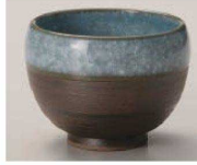
I368-139 黒土かいらぎ青煎茶 φ8.7×7cm (250cc) (陶) JPN 1,600円