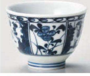
T368-369 間取花ミニ4茶 6.3×4.5cm (70cc) (藍) JPN 730円