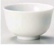
T368-349 白2.4反千茶 7.2×4.4cm (80cc) (藍) JPN 730円