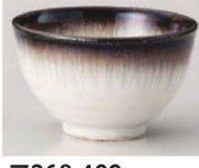
A368-409 さび流し大煎茶 φ10.5×6cm (290cc) (藍) JPN 650円