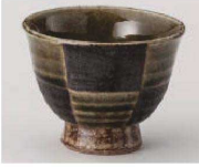
U368-179 織部市松高台煎茶 φ9×7cm (170cc) (陶) JPN 1,590円