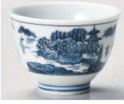
T368-359 山水ミニ4茶 6.3×4.5cm (70cc) (藍) JPN 730円