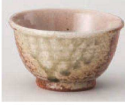
X368-279 信楽そり湯呑 φ9×5.5cm (150cc) (陶) JPN 1,200円