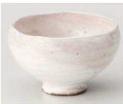
O368-059 薄紅粉引波瀾煎茶 φ9.5×7.3cm (陶) JPN 2,950円