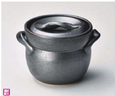
ス385-089 黒釉ご飯釜(2合炊)