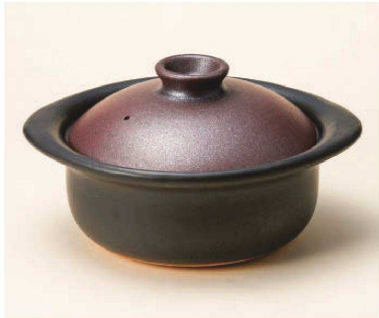
ス385-059 鉄赤三合御飯鍋