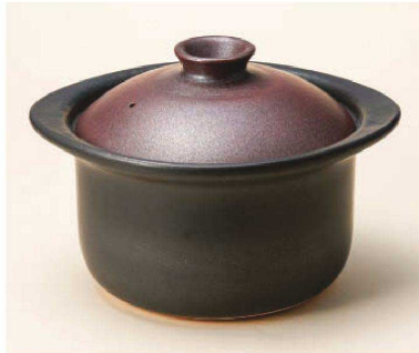
ス385-019 鉄赤五合御飯鍋 28×24×18cm JPN