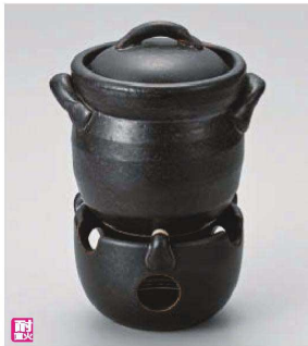
ス385-169 黒釉ミニご飯釜(0.5合炊)