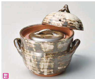
ス385-069 唐津刷毛目ご飯鍋2合炊(中蓋付) 22.5×φ16.5×20cm(身13.7cm) (陶) (萬古焼) JPN