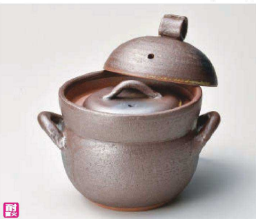
ス385-079 南蛮黒吹ご飯鍋2合炊(中蓋付) 22.5×φ16.5×20cm(身13.7cm) (陶) (萬古焼) JPN