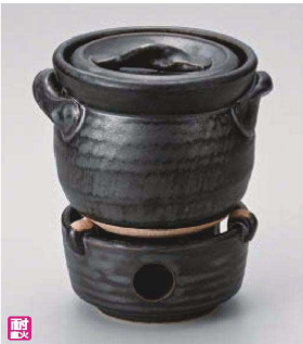
ス385-139 黒釉ご飯釜(1合炊)