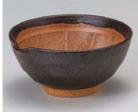
1395-089 黒結晶片口6.0鉢 18×9cm (陶) JPN 3,980円 1395-099 黒結晶片口5.0鉢 15.5×7.5cm (陶) JPN 3,300円