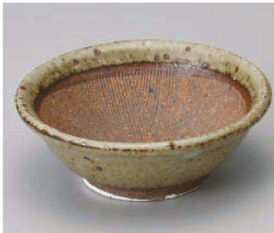
カ395-249 唐津3.2寸すり鉢 9.8×3.5cm (陶) JPN 1,600円