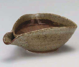
オ395-129 唐津花紋片口(中) 17.5×13×6.8cm (陶) JPN 5,150円 オ395-139 唐津花紋片口(小) 14.5×11×5cm (陶) JPN 3,950円