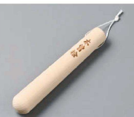
ワ395-279 檜・ミニすりこぎ 18cm 約φ3×L18.5cm (木) JPN 1,090円