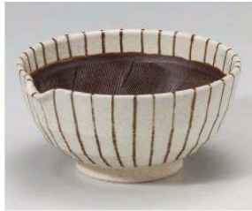
1395-019 錆十草片口6.0鉢 19×18×9cm (陶) JPN 4,000円 1395-029 錆十草片口5.0鉢 16×15.5×7.5cm (陶) JPN 3,300円