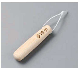
ワ395-289 檜・ミニすりこぎ 12.5cm 約φ2.7×L12.5cm (木) JPN 960円

多用丼 (30cm~20cm) 多用丼 (20cm~18cm) 多用丼 (18cm~16cm) 多用丼 (16cm~15cm) 多用丼 (15cm~13cm)