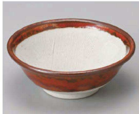
ト395-219 赤3.5スリ小付 φ10.9×4cm (磁) JPN 850円