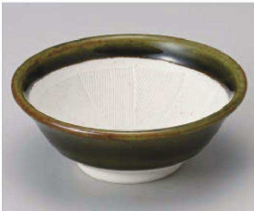
ト395-229 織部3.5スリ小付 φ10.9×4cm (磁) JPN 850円