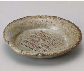
カ395-239 唐津片口おろし器ミニ 9×1.5cm (陶) JPN 1,980円