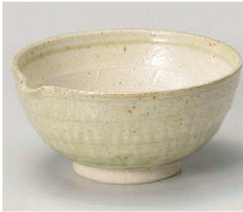
カ395-069 ヒワ釉6寸片口すり鉢 19×9cm (陶) JPN 3,500円 カ395-079 ヒワ釉5寸すり鉢 φ15.5×7.5cm (陶) JPN 2,900円