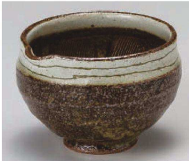
カ395-209 泥グシ彫り三.五寸丸片口スリ鉢 φ10×7cm (陶) JPN 2,200円