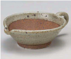
オ395-189 ゴマダレ入小鉢 15×11×5cm (陶) JPN 2,400円