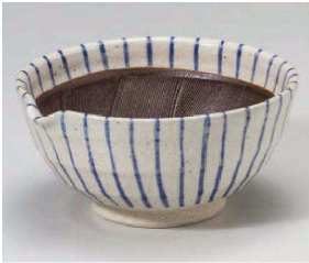
1395-039 青十草片口6.0鉢 19×18×9cm (陶) JPN 4,000円 1395-049 青十草片口5.0鉢 16×15.5×7.5cm (陶) JPN 3,300円