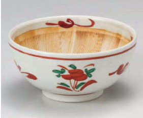
ヤ395-109 立花灰釉6.0スリ鉢 φ18.5×9cm (磁) JPN 3,900円 ヤ395-119 立花灰釉5.0スリ鉢 φ15.5×7.5cm (磁) JPN 2,900円