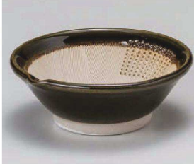
オ395-149 織部4.0スリオロシ 12.2×12×4.5cm (陶) JPN 1,950円 オ395-159 織部3.2スリオロシ 10.2×9.8×3.5cm (陶) JPN 1,700円