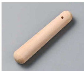
カ395-259 すり棒 13cm 13×2.5cm (木) CHN 650円