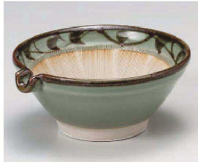
ホ395-169 唐草5.0片口スリ鉢 15×6.5cm (陶) JPN 2,600円 ホ395-179 唐草4.0片口スリ鉢 12.5×5.5cm (陶) JPN 2,200円