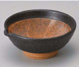
カ395-199 黒結晶4.0片口すり鉢 11.8×11.2×5.1cm (陶) JPN 2,000円