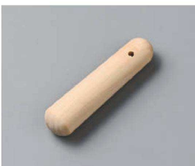
カ395-269 10cmスリ棒 10×2.5cm (木) CHN 550円