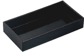
E636-029 [TA]8寸 遊菜箱 黒へぎ目 [洗] 24.4×12.6×4.5cm 内寸23.3×11.5×3.9cm JPN 2,750円