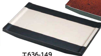
E636-149 [A]8寸 大名型盛込台 銀塗分 24×15×2.4cm JPN 3,500円