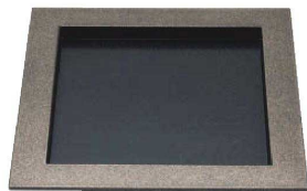
E636-059 [A]8寸 つけば付正角盆 銀鱗内乾漆 23×23×2cm・内寸17.4×17.4×H1.3cm JPN 2,400円