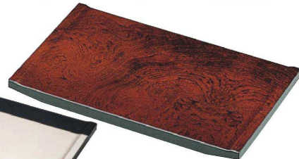
E636-159 [A]尺0寸 大名型盛込台 樺木目 30×18×3.2cm JPN 3,750円