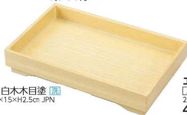
E636-169 [TA]8寸 長角山路盛器 白木木目塗 [洗] 25×16.2×4.5cm・内寸23.8×15×H2.5cm JPN 4,750円