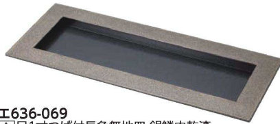
E636-069 [A]尺1寸 つけば付長角無地皿 銀鱗内乾漆 32.9×13.6×2cm JPN(有効内寸 27.3×8cm) 2,600円