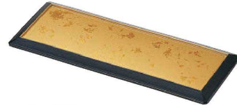
E636-079 [TA]ダイヤ盛皿 色紙金箔測黒 (H.C塗) [洗] 28.2×11×1.9cm JPN(有効内寸 25×8cm) 4,350円