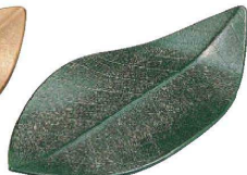
E637-049 [A](大)新この葉皿 グリーン(裏黒塗) 30×15.5×3.2cm JPN 2,200円