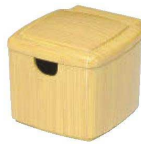
E637-159 [TA]隅丸ガリ入れ 白木塗(切込有) [洗] 10×11.1×8.8cm JPN 3,000円