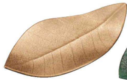
E637-039 [A](小)新この葉皿 黄金色(裏黒塗) 23×12×2.6cm JPN 2,400円