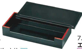
E637-089 [TA]グリーン天朱 本体 [洗] 16×9.8×4.5cm JPN 1,800円