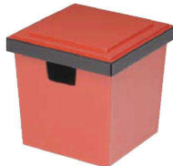
E637-149 [TA](大)角ガリ入れ 朱淵黒(切込有) [洗] 12×12×11.6cm JPN 3,900円