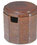
E637-179 [TA]木彫ガリ入れ 板(切込有) φ10.5×10.5cm JPN 4,300円