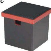
E637-139 [TA](小)角ガリ入れ 黒淵朱(切込有) [洗] 11×11×10.9cm JPN 2,800円