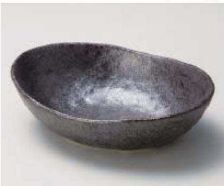
I077-609 イブシ黒楕円小鉢 大 19.3×14.7×5.7cm(陶)JPN 1,580円 I077-619 イブシ黒楕円小鉢 小 16×11×4.3cm(陶)JPN 1,100円