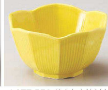
Ho077-559 黄十角小鉢(大) φ10.5×6cm(陶)JPN 1,650円 Ho077-569 黄十角小鉢(小) φ8.5×5cm(陶)JPN 1,250円 Ho077-579 黄十角珍珠味 φ5.7×3.5cm(陶)JPN 780円