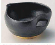
M077-149 黒織部多用途小鉢 12×11×6cm(陶)JPN 2,100円 M077-159 黒織部多用途小付 10.7×9.8×4.8cm(陶)JPN 1,650円