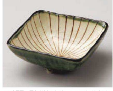
Q077-479 織部内筋三つ足角鉢(大) 12.8×12.8×5cm(陶)JPN 2,310円 Q077-489 織部内筋三つ足角鉢(小) 9.7×9.7×5.7cm(陶)JPN 1,800円