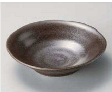
I077-049 レトロマット黒5.0浅鉢 φ16×4.5cm(陶)JPN 500円 I077-059 レトロマット黒4.0浅鉢 φ14×4cm(陶)JPN 440円 I077-069 レトロマット黒3.3浅鉢 φ11×3.5cm(陶)JPN 380円