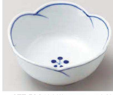
Q077-539 染付梅ライン4.0小鉢 φ12.5×5.8cm(陶)JPN 2,040円 Q077-549 染付梅ライン3.5小鉢 φ10.5×5.3cm(陶)JPN 1,680円