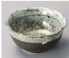
I077-649 花ごよみ黒吹白砂地掛分け3.6小鉢 φ10.8×5cm(陶)JPN 830円 I077-659 花ごよみ黒吹白砂地掛分け3.0小付 φ9×5cm(陶)JPN 720円