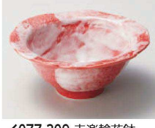
I077-309 赤染輪花鉢 φ15.3×6.3cm(陶)JPN 1,700円 I077-319 赤染輪花小鉢 φ11.3×5.2cm(陶)JPN 1,200円