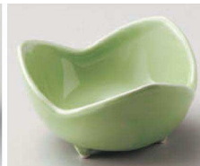
A077-129 ヒワミツ山小鉢(大) 10.6×6.1cm(陶)JPN 2,000円 A077-139 ヒワミツ山小鉢(小) 8.5×5.5cm(陶)JPN 1,700円