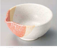
Q077-499 なごみ片口4.0鉢 12.5×11.5×5.9cm(陶)JPN 1,920円 Q077-509 なごみ片口3.0鉢 11.7×9.5×4.1cm(陶)JPN 1,320円