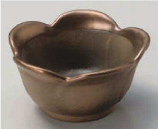
Q077-389 銅彩花小鉢(大) φ11×5.8cm(陶)JPN 2,200円 Q077-399 銅彩花小鉢(小) φ8.5×5.6cm(陶)JPN 1,600円