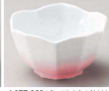
Ho077-229 ピンク吹十角小鉢(大) 10.5×6cm(陶)JPN 2,000円 Ho077-239 ピンク吹十角小鉢(小) 8.5×5cm(陶)JPN 1,600円 Ho077-249 ピンク吹十角珍珠味 φ5.7×3.5cm(陶)JPN 900円