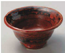
T077-079 赤柚子小鉢 大 φ12.5×6.5cm(陶)JPN 2,100円 T077-089 赤柚子小鉢 小 φ10.5×5.5cm(陶)JPN 1,600円