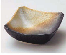
Q077-519 夜明け四角鉢中 13.8×13.8×5.6cm(陶)JPN 2,320円 Q077-529 夜明け四角鉢小 9.9×9.9×4.2cm(陶)JPN 1,150円