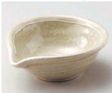
Q077-629 一珍唐津4.5片口小鉢 15×14×5.5cm(陶)JPN 1,790円 Q077-639 一珍唐津4.0片口小鉢 12×11.5×4.5cm(陶)JPN 1,360円