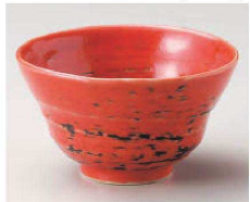
To077-589 紅もえぎ4.0鉢 φ12×7cm(陶)JPN 1,900円 To077-599 紅もえぎ3.0鉢 φ9.3×5.6cm(陶)JPN 1,400円