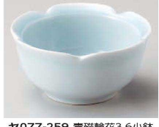
Ya077-259 青磁輪花3.6小鉢 φ11×5.5cm(陶)JPN 1,600円 Ya077-269 青磁輪花3.2小鉢 φ9.5×4.7cm(陶)JPN 1,200円 Ya077-279 青磁輪花珍珠味 φ7.5×3.5cm(陶)JPN 1,000円