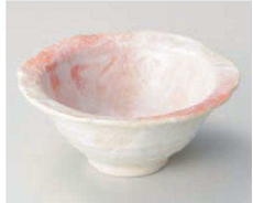
Ka077-369 桜志野輪花鉢(大) φ15×6.3cm(陶)JPN 1,550円 Ka077-379 桜志野輪花鉢(小) φ11.2×5.1cm(陶)JPN 1,100円