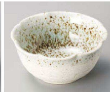
I077-669 花ごよみ白吹白砂地掛分け3.6小鉢 φ10.8×5cm(陶)JPN 830円 I077-679 花ごよみ白吹白砂地掛分け3.0小付 φ9×5cm(陶)JPN 720円