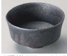
A077-209 黒結晶12.5cm高台小鉢 φ12.5×7cm(陶)JPN 1,850円 A077-219 黒結晶11cm高台小鉢 φ11×6.2cm(陶)JPN 1,580円