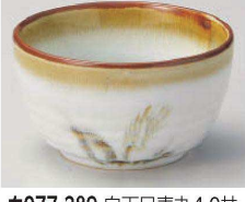
Ka077-289 白天目麦丸4.0并 φ12.2×7.2cm(陶)JPN 1,550円 Ka077-299 白天目麦丸3.6并 φ10.5×6.5cm(陶)JPN 1,250円