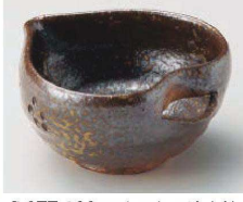
M077-189 灰吹き多用途小鉢 12×11×6cm(陶)JPN 2,100円 M077-199 灰吹き多用途小付 10.7×9.8×4.8cm(陶)JPN 1,650円