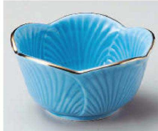
Q077-439 測金トルコ葉型3.3小鉢 10×5cm JPN 1,620円 Q077-449 測金トルコ葉型2.8小鉢 8.8×5.2cm JPN 1,510円