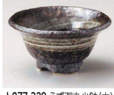
T077-329 うず潮丸小鉢(大) φ12.8×6.5cm(陶)JPN 2,000円 T077-339 うず潮丸小鉢(小) φ10.5×5cm(陶)JPN 1,500円