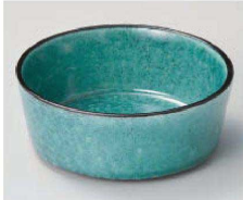
Ka077-409 kasaneトルコ釉鉢 中 φ12×4.7cm(陶)JPN 1,550円 Ka077-419 kasaneトルコ釉鉢 小 φ10×4cm(陶)JPN 1,300円 Ka077-429 kasaneトルコ釉鉢 ミニ φ8.8×2.5cm(陶)JPN 1,100円