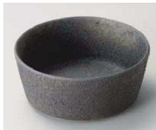
Ka077-099 kasane燗銀鉢大 φ14.5×6cm(陶)JPN 2,050円 Ka077-109 kasane燗銀鉢中 φ12×4.7cm(陶)JPN 1,550円 Ka077-119 kasane燗銀鉢小 φ10×4cm(陶)JPN 1,380円