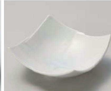
I077-459 青地市松彫4.5鉢 14×14×5.2cm(陶)JPN 1,700円 I077-469 青地市松彫3.5鉢 11×11×6cm(陶)JPN 1,450円