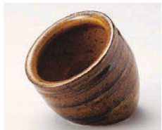
Ya077-019 鉛斑点たご壺(大) φ10.5×11.3cm(陶)JPN 1,900円 Ya077-029 鉛斑点たご壺(中) φ7.7×8cm(陶)JPN 1,300円 Ya077-039 鉛斑点たご壺(小) φ5.7×5.5cm(陶)JPN 850円