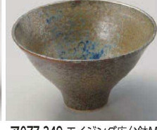
A077-349 エイジング広台鉢M φ12.5×7.2cm(陶)JPN 1,800円 A077-359 エイジング広台鉢S φ10×5.9cm(陶)JPN 1,300円