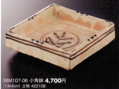
手造り粉引若松紋

38Q107-05 丸向付 4,800円 (15.2x5cm) 土物 201096