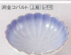
瀾金コバルト [上絵] [レ不可]