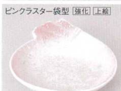
ピンクスター袋型 [強化] [上絵]