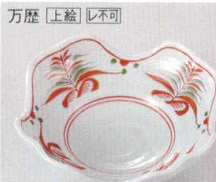
万歴 [上絵] [レ不可]