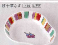
虹水草なす [上絵] [レ不可]