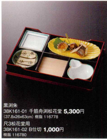
黒瀾朱 38K161-01 千筋舟瀾松花堂 5,300円 (37.8x26x63cm) 樹脂 116778 尺3松花堂用 38K161-02 B仕切 1,000円 樹脂 116780