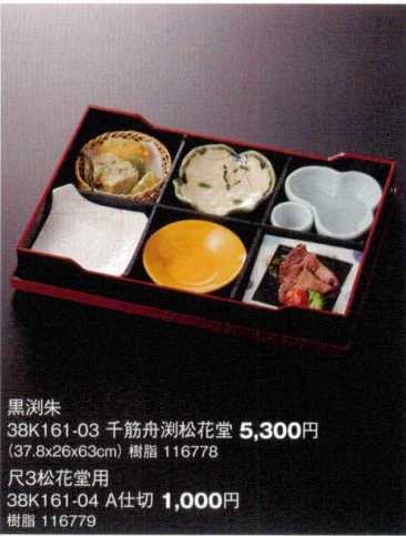
黒瀾朱 38K161-03 千筋舟瀾松花堂 5,300円 (37.8x26x63cm) 樹脂 116778 尺3松花堂用 38K161-04 A仕切 1,000円 樹脂 116779