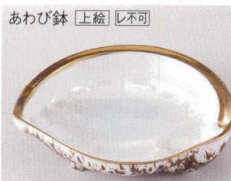
あわび鉢 [上絵] [レ不可]