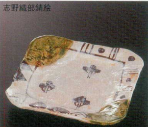
志野織部錆絵 38K212-10 角皿 2,000円 (16x1.8cm) 土物 116947