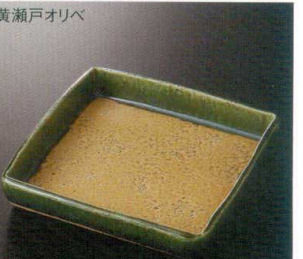
黄瀬戸オリベ 38K212-08 切立前菜皿 3,100円 (16.5x3cm) 土物 114700