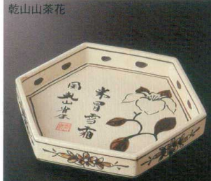
乾山山茶花 38K212-05 六角6寸皿 4,500円 (20.5x18x3.5cm) 土物 118939