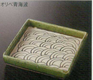
オリベ青海波 38K212-07 切立前菜皿 3,100円 (16.5x16.3x3cm) 土物 118100