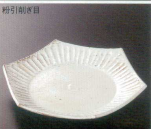
粉引削ぎ目 38K212-18 六角皿(小) 2,700円 (19.4x17x3cm) 土物 115788 38K212-19 六角皿(大) 3,900円 (24x21.2x3.7cm) 土物 115789