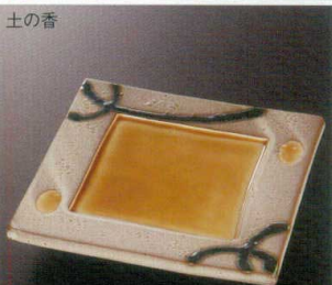
土の香 38M212-14 正角皿 3,600円 (18.2x3cm) 422005