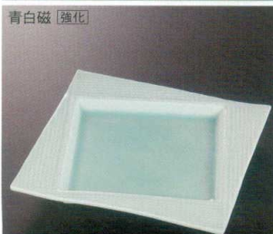
青白磁 [強化] 38H212-17 スクエアプレート19cm 7,850円 (19.3X2.2cm) 911577