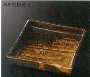
あめ釉掛分け 38K212-09 砂目正角皿 3,300円 (16.5x16.5x3cm) 118560