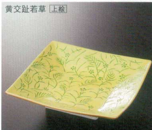
黄交趾若草 [上絵] 38H212-13 角和皿 4,500円 (15x15x3.9cm) 910751