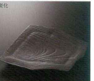
炭化 38K212-12 木目変形角皿 4,200円 (19.9x19.3x1.5cm) 土物 115830