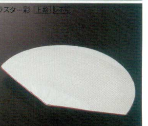
ラスター彩 [上絵] [不可] 38K212-16 扇皿 4,200円 (16x23x1.2cm) 118849