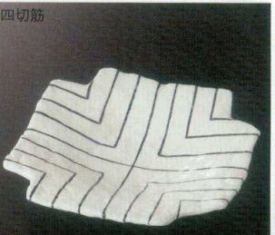
四切筋 38H212-11 和皿 3,500円 (18x18x3cm) 910242