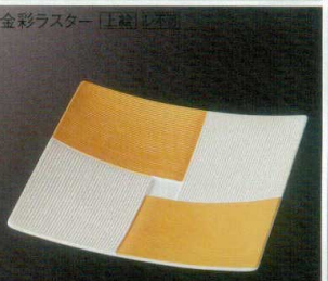
金彩ラスター [上絵] [不可] 38K212-15 市松角皿 5,000円 (18x18x2.7cm) 118973