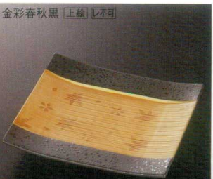
金彩春秋黒 [上絵] [不可] 38K212-03 櫛目前菜皿 4,200円 (18.1x17.1x2.3cm) 114158