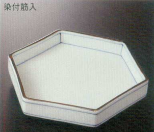
染付筋入 38K212-06 六角切立皿 3,500円 (19.4x17x3.2cm) 116944