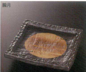
朧月 38K212-02 正角皿 3,200円 (17x17x3.2cm) 102049