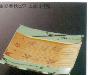
金彩春秋ヒワ [上絵] [不可] 38K212-04 櫛目前菜皿 4,200円 (18.1x17x2.3cm) 114155