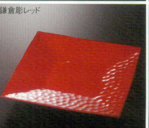
鎌倉彫レッド 38K212-20 スクエア皿 4,000円 (17.2x17.2x2.3cm) 118936 38K212-21 スクエア皿L 6,900円 (24.2x24x2.5cm) 118935