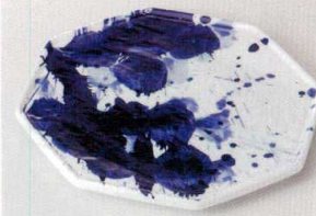
38K215-18 八角皿 2,900円 (20.8x2cm) 116973