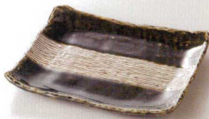
38E215-05 9.0長角皿 4,950円 (22.2x19.7x3cm) 711358