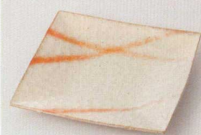
38K215-17 鎌倉彫スクエア皿S 3,000円 (17x17x2.2cm) 118914