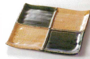
38K215-16 正角仕切皿 2,000円 (19.2x19.2x1.8cm) 土物 115334