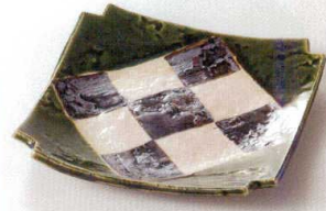
38K215-04 角切り皿 2,000円 (19x18.6x2.7cm) 土物 115999