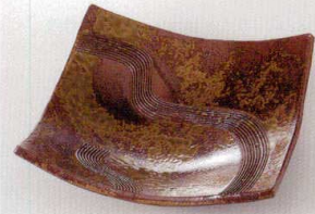
38K215-14 四方上り皿 2,000円 (18x5.3cm) 土物 109836