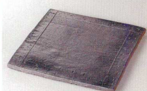
38K215-12 測石目19cm正角皿 2,000円 (19x19x1.3cm) 土物 118421