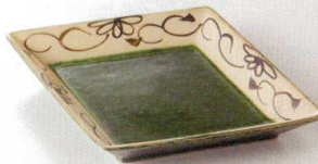
38K215-09 菱形前菜皿 2,500円 (24.6x18.7x3cm) 土物 115319