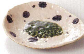
38K215-03 たたき皿 2,000円 (22.4x20.8x3.6cm) 土物 116001