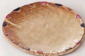
38K215-02 丸皿 2,500円 (20.6x20.5x2.3cm) 土物 116981