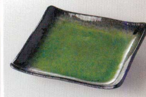
38K215-20 正角皿(小) 2,400円 (18.5x18.4x3.8cm) 118026