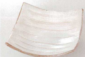
38K215-13 四方上り皿 2,000円 (19.7x19x5.5cm) 土物 109835