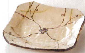
38K215-06 なで角皿 2,000円 (19.4x19.5x2.8cm) 土物 116005