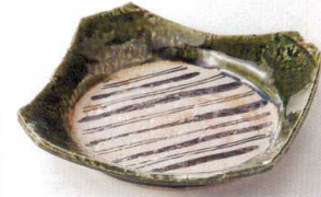
38K215-07 なで角皿 2,000円 (19.4x19.4x2.8cm) 土物 116006