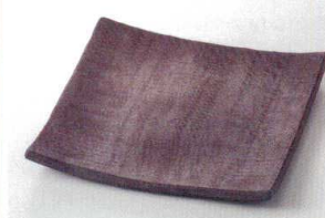
38K215-15 正角皿 2,000円 (18.3x18.2x2.1cm) 土物 116563