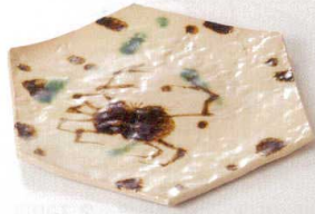
38K215-01 六角皿 2,100円 (18.4x18.8x1.4cm) 土物 116004