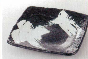
38H215-19 正角皿 2,300円 (18x18x3cm) 910250