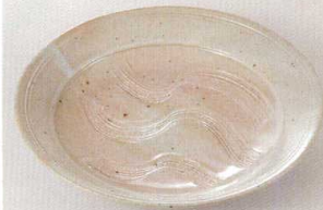
38K215-08 前菜皿 2,100円 (20.5x3.6cm) 土物 109473