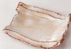
38K215-10 6寸角皿 2,200円 (19.3x18.4x4cm) 土物 109875