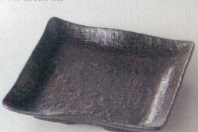
38K218-18 正角皿 1,500円 (18.3x3.4cm) 118486