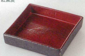
38K218-04 正角前菜皿 1,500円 (15x15x3.5cm) 111342