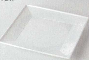
38K218-22 スクエア皿 2,100円 (21.2x2.2cm) 118345