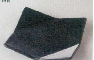
38K218-16 四方折皿 1,200円 (15.3x15.3x3cm) 118287