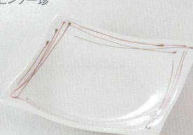
38K218-07 正角皿 1,500円 (17.3x17.2x3.2cm) 112035