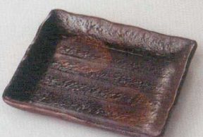
38K218-13 正角皿(小) 960円 (16.3x16.3cm) 116980