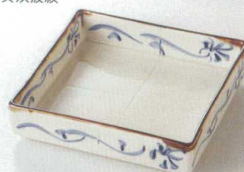
38K218-03 正角前菜皿 1,400円 (15x3.5cm) 113346