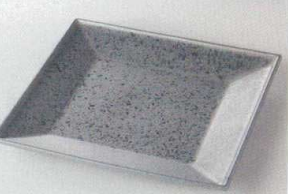
38K218-21 スクエア皿 2,100円 (21.2x2.2cm) 118346