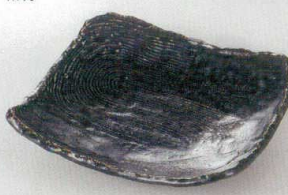
38K218-10 くり目角浅皿 1,400円 (17.7x16.3x4cm) 112040