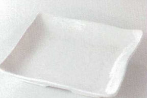
38K218-17 正角皿 1,500円 (18.3x3.4cm) 118475