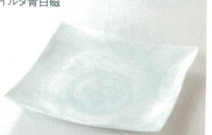
38H218-24 18cm正角皿 2,800円 (18x18x1.9cm) 910439