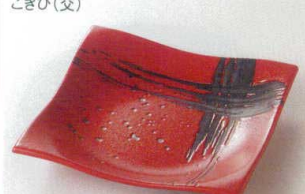
38K218-08 正角皿 1,500円 (17.5x17.5x3cm) 115766