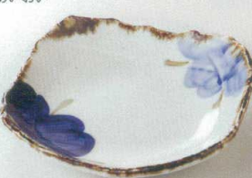
38K218-11 四角鉢 1,500円 (17.4x17x3.5cm) 115375