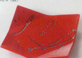
38K218-15 正角皿 1,500円 (15.5x15.5x3cm) 116475