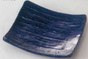
38K218-05 四つ足前菜皿 1,800円 (16.5x16.5x3.5cm) 116975