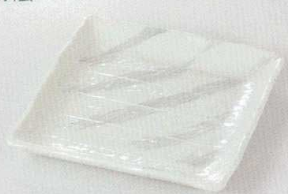
38K218-14 正角皿(小) 960円 (16.3x16.3cm) 113651