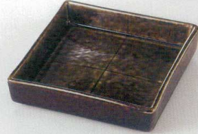
38K218-01 正角前菜皿 1,400円 (15x3.7cm) 111182