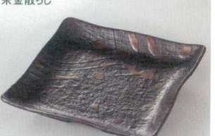
38K218-20 正角皿 1,400円 (18.2x3.5cm) 111211