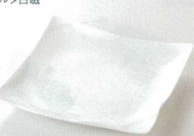
38H218-23 18cm正角皿 2,800円 (18x18x1.9cm) 911027