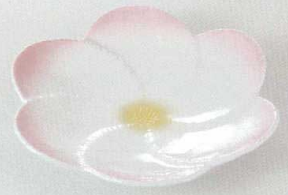
38K218-09 花型皿 1,800円 (19.5x3.4cm) 112048