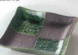
38K218-19 正角皿 1,500円 (18.3x3.4cm) 115475