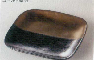
38K218-12 なで角5.0皿 1,400円 (15.8x2.3cm) 118286