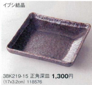
イブシ結晶 38K219-15 正角深皿 1,300円 (17x3.2cm) 118576