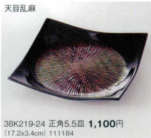
天目乱麻 38K219-24 正角5.5皿 1,100円 (17.2x3.4cm) 111184