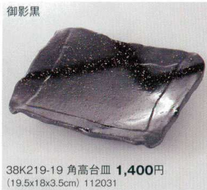
御影黒 38K219-19 角高台皿 1,400円 (19.5x18x3.5cm) 112031