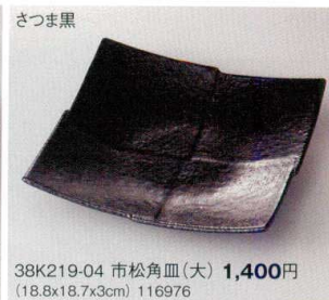
さつま黒 38K219-04 市松角皿(大) 1,400円 (18.8x18.7x3cm) 116976