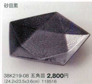
砂目黒 38K219-08 五角皿 2,800円 (24.2x23.5x3.6cm) 118516