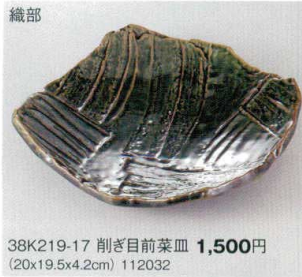
織部 38K219-17 削ぎ目前菜皿 1,500円 (20x19.5x4.2cm) 112032