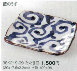
藍のうず 38K219-09 たたき皿 1,500円 (20x17.5x2.2cm) 土物 109496