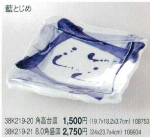
藍とじめ 38K219-20 角高台皿 1,500円 (19.7x18.2x3.7cm) 108753 38K219-21 8.0角盛皿 2,750円 (24x23.7x4cm) 109934