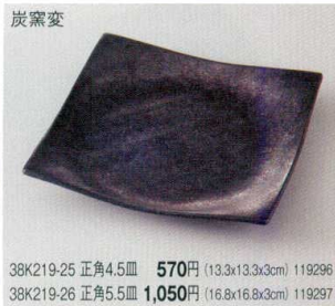
炭窯変 38K219-25 正角4.5皿 570円 (13.3x13.3x3cm) 119296 38K219-26 正角5.5皿 1,050円 (16.8x16.8x3cm) 119297