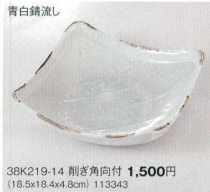
青白錆流し 38K219-14 削ぎ角向付 1,500円 (18.5x18.4x4.8cm) 113343