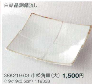
白結晶測錆流し 38K219-03 市松角皿(大) 1,500円 (19x19x3.5cm) 119338