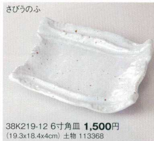
さびうのふ 38K219-12 6寸角皿 1,500円 (19.3x18.4x4cm) 土物 113368