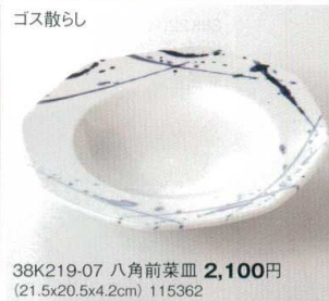
ゴス散らし 38K219-07 八角前菜皿 2,100円 (21.5x20.5x4.2cm) 115362