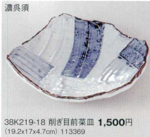
濃呉須 38K219-18 削ぎ目前菜皿 1,500円 (19.2x17x4.7cm) 113369