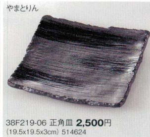
やまとりん 38F219-06 正角皿 2,500円 (19.5x19.5x3cm) 514624