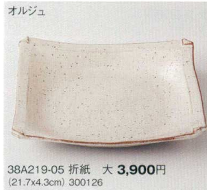
オルジュ 38A219-05 折紙 大 3,900円 (21.7x4.3cm) 300126