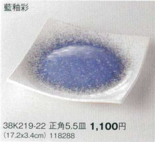
藍袖彩 38K219-22 正角5.5皿 1,100円 (17.2x3.4cm) 118288