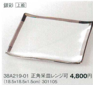
銀彩 [上蓋] 38A219-01 正角采皿レンジ可 4,800円 (18.5x18.5x1.5cm) 301105

38A219-01 正角采皿レンジ可 4,800円 (18.5x18.5x1.5cm) 301105