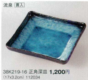
流泉 [裏入] 38K219-16 正角深皿 1,200円 (17x3.2cm) 112034