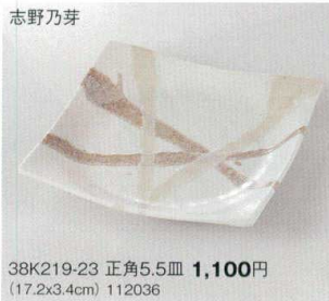
志野乃芽 38K219-23 正角5.5皿 1,100円 (17.2x3.4cm) 112036