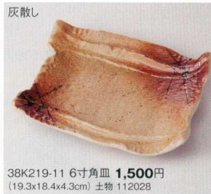
灰散し 38K219-11 6寸角皿 1,500円 (19.3x18.4x4.3cm) 土物 112028