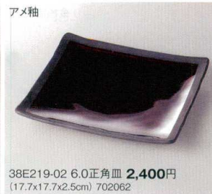
アメ釉 38E219-02 6.0正角皿 2,400円 (17.7x17.7x2.5cm) 702062