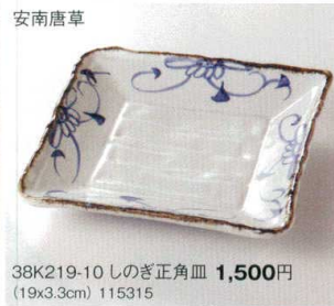
安南唐草 38K219-10 しのぎ正角皿 1,500円 (19x3.3cm) 115315