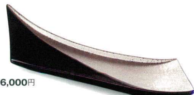
黒プラチナ [上絵] 不可 38F029-22 剣先長皿 6,000円 (35x7.5x4cm) 516246