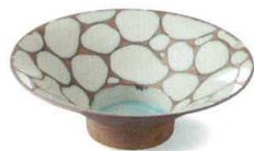
金彩水玉 38M029-13 高台鉢 9,000円 (21.3x7.3cm) 425201