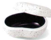
御影 38K029-07 玉石蓋物 4,700円 (13.5x10x7.5cm) 116490