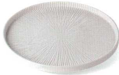
グレーマット 38K029-14 しのぎ彫切立19cm皿 4,200円 (18.8x1.7cm) 117948 38K029-15 しのぎ彫切立23cm皿 5,300円 (23x1.8cm) 117949