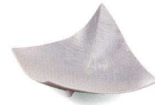
臙銀彩 [上絵] 38K029-08 一方上り小鉢 3,400円 (19.2x15x8.5cm) 118033