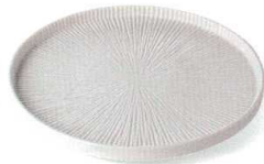
グレーマット 38K029-14 しのぎ彫切立19cm皿 4,200円 (18.8x1.7cm) 117948 38K029-15 しのぎ彫切立23cm皿 5,300円 (23x1.8cm) 117949