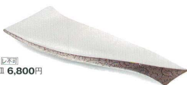
プラチナタロ唐草 [上絵] 不可 38K029-21 変形付皿 6,800円 (32x12x2cm) 116877