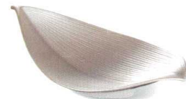
銀彩 [上絵] 不可 38K029-10 葉型8.5向付 6,300円 (25.5x14.8x5.6cm) 115852