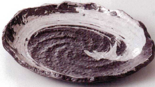
38V293-01 小判皿 4,200円 (30.5x26.5x3cm) 土物 970332