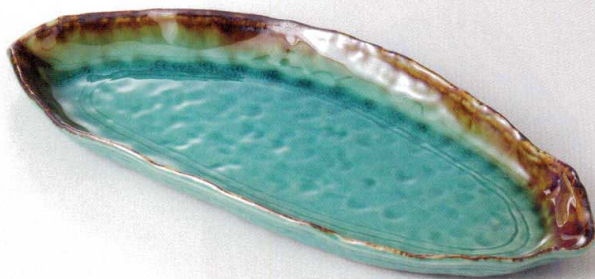
38K293-06 木の葉皿 2,480円 (38.2x16.9x2.9cm) 116063