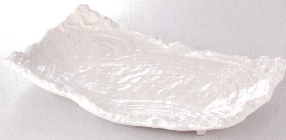
38V293-04 長角皿 3,200円 (32.5x19x5cm) 半磁器 970016