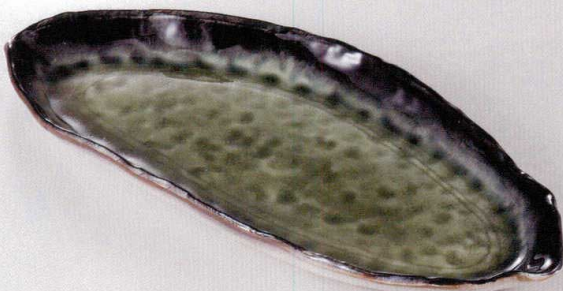
38K293-07 木の葉皿 2,480円 (36.8x16.5x2.9cm) 114753