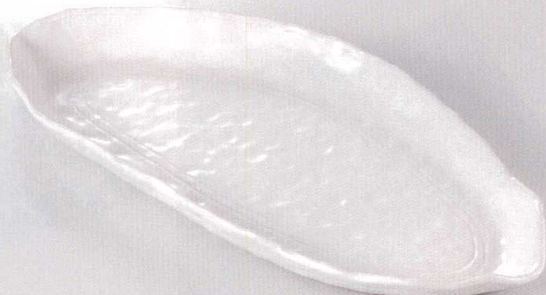
38K293-08 木の葉皿 2,480円 (36.8x16.6x3cm) 102928