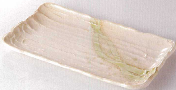
38A293-03 荒ソギほっけ皿 4,800円 (33.5x18.5x2.5cm) 302663