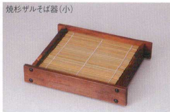
焼杉ザルそば器(小) 38S360-05 (ミス付) 2,700円 (19x20cm) 竹製スプルス 800191