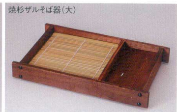
焼杉ザルそば器(大) 38S360-06 (ミス付) 3,300円 (19x29cm) 竹製スプルス 800190