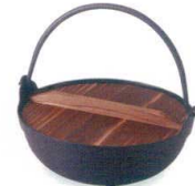
新ふるさと鍋 38K416-14 22cm 14,000円 (22x10.5cm) 119544 38K416-15 24cm 20,500円 (24x11.5cm) 119543