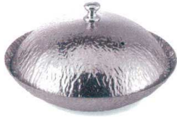
あられ鍋(蓋付) [中国] 38K416-01 (小) 7,200円 (17.3x11.5cm) ステンレス 112460 38K416-02 (大) 7,200円 (19x11.5cm) ステンレス 112459