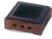
民芸こんろ [中国] 38K416-20 焼杉(小) 5,500円 (12x12x8cm) アルミ合金杉 110224 38K416-21 焼杉(大) 7,400円 (16.2x16.2x8.2cm) アルミ合金杉 110225