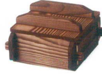
せいろ蒸し [中国] 38K416-04 焼杉(小)竹ス付 6,500円 (14x14x8cm) 杉 112466 38K416-05 焼杉(中)竹ス付 7,200円 (18x18x9cm) 杉 112465