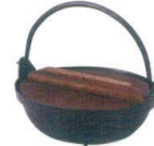
ふるさと千段鍋 [中国] 38K416-13 段付黒φ15 3,800円 (15x6.5cm) アルミ合金杉 111722