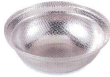
しぐれ鍋 [中国] 38K416-03 小丸 4,100円 (15x5cm) ステンレス 112461