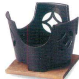
丸こんろ七宝黒 [中国] 38K416-09 (大)セット 2,300円 (13x9.5cm) アルミ合金杉 110230