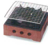
民芸コンロ [中国] 38K416-18 茶 6,500円 (15.9x8.9cm) 119585