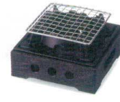
民芸コンロ [中国] 38K416-19 黒 6,500円 (15.9x8.9cm) 119584