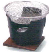
丸こんろ黒 [中国] 38K416-10 φ12受網 1,500円 (11x3cm) ステンレス 110250 38K416-11 φ14.5受網 1,650円 (13.5x4cm) ステンレス 110249 38K416-12 (大)セット 2,300円 (13.7x9.5cm) アルミ合金杉 110231