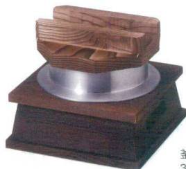
釜めしセット [中国] 38K416-27 (大)焼杉 11,000円 (17.5x17.5x14.5cm) アルミ合金杉 111726