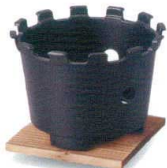
丸こんろ [中国] 38K416-08 むさしセット 3,700円 (13x9.5cm) アルミ合金杉 110232