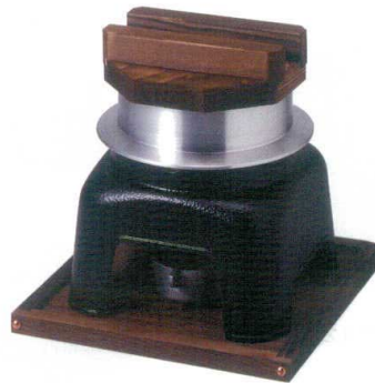
お釜かまどセット [中国] 38K416-28 (小)黒 11,000円 (18x18x17.5cm) アルミ合金杉 110272 38K416-29 (中)黒 12,000円 (20.5x20.5x19.3cm) アルミ合金杉 111727 38K416-30 (大)黒 12,000円 (20.5x20.5x20.5cm) アルミ合金杉 111728