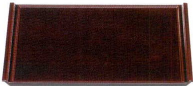
フライト盆 溜SH塗 A