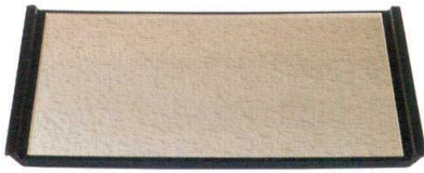
フライト盆 シャンバンゴールド測黒SL A