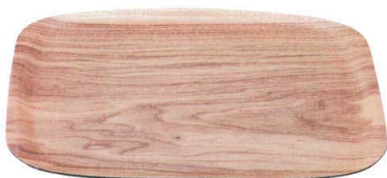
耐熱 スイントレー ナチュラル弱SL TA 弱ノンスリップ加工