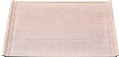
木目フライト盆 ホワイトウッド弱SL A 弱ノンスリップ加工