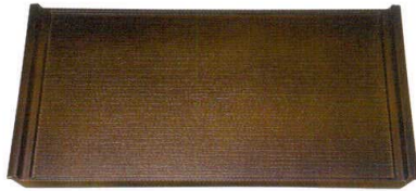
木目フライト盆 オリーブブラウン弱SL A 弱ノンスリップ加工