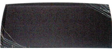
わたらせ盆 黒SLタタキ白乱糸 A ノンスリップ加工