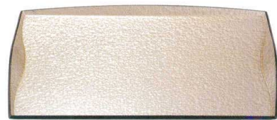
ノンスリップ加工