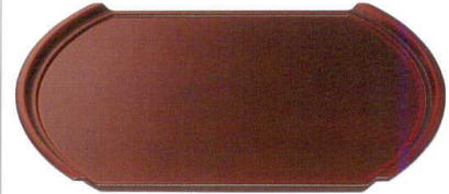
小判型フライト盆 溜SH塗 A