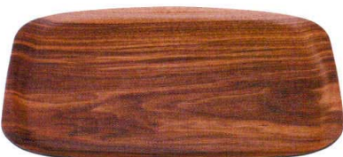
耐熱 スイントレー ダークブラウン弱SL TA 弱ノンスリップ加工