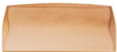
測付ウェーブトレイ 和桎目弱SL TA 弱ノンスリップ加工