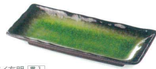
ヒスイ有明 [買入] 38K054-15 付出皿 1,600円 (24x10.8x3cm) 118025