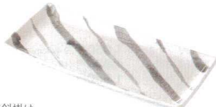
織部斜掛け 38K054-13 長角皿 1,400円 (27.8x13x2.5cm) 119169