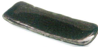
オリベ 38K054-11 石目サンマ皿 2,400円 (31.5x12.2x2.7cm) 118615