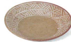
線彫灰釉 38K054-17 6.0浅鉢 1,900円 (19.4x4.2cm) 土物 116658