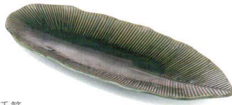
織部千筋 38K054-14 葉型長皿 1,700円 (32.8x13.3x2.8cm) 117024