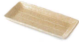
黄瀬戸 38K054-12 削ぎ長角皿S 920円 (22.1x10.2x2.4cm) 118890