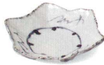
古染つむぎ 38K059-03 紅葉鉢 1,450円 (19.2x17x4.7cm) 113002