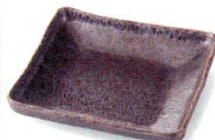
イブシ結晶 38K059-06 深口7寸正角皿 1,300円 (17x3.2cm) 118576