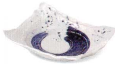
呉須荒刷毛 38K059-04 二重向付 1,500円 (20.5x16x5.4cm) 109679