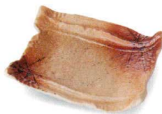
灰散し 38K059-18 6寸角皿 1,500円 (19.3x18.4x4.3cm) 土物 112028