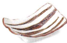
錆ライン 38K059-15 変形角鉢 1,150円 (18.5x12.7x6cm) 113292