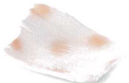
桃色志野 38K059-16 削ぎ前菜皿 2,700円 (23.5x19x5cm) 111177