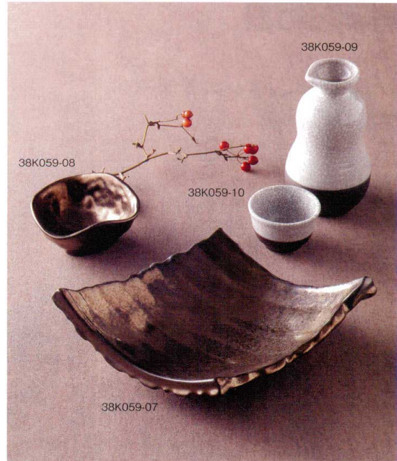
ゴールド窯変 38K059-07 四ツ足瓦皿 3,100円 (18x17x6.5cm) 118162 38K059-08 三角小鉢 650円 (9.7x9.6x4.3cm) 118158 墨貫入 38K059-09 瓢型大徳利 2,700円 (7.6x14cm 300cc) 土物 119389 38K059-10 ぐい呑(大) 1,050円 (6.5x4.3cm 75cc) 土物 119388