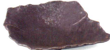
熔岩流 38K059-19 ちぎり9.0鉢 3,500円 (28x22.5x6.5cm) 111006