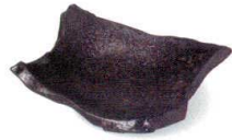
さつま黒 38K059-01 切落し変型向付 1,400円 (17.5x15.7x4.5cm) 115525