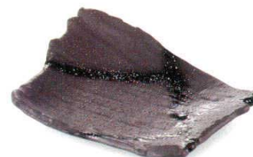
御影黒 38K059-17 削ぎ前菜皿 2,900円 (24x20x5cm) 111178