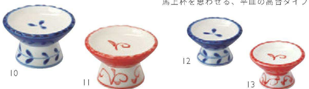
馬上杯を思わせる、平皿の高台タイプ