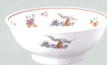
12-119-13-76193936 ¥1,900 反高台20cm井 19.6×7.7-1,070cc