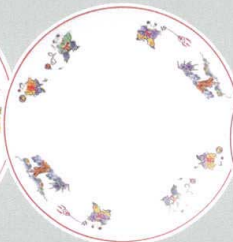
12-119-2-35090936 ¥1,950 メタ玉24cm皿 24×2.6