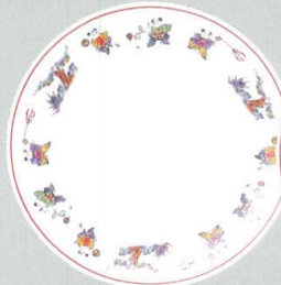
12-119-1-35000936 ¥2,600 メタ玉26cm皿 26×2.8