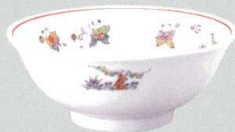
12-119-11-00030936 ¥2,200 反高台22cm井 21.4×8.6-1,400cc