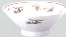
12-119-9-76210936 ¥2,150 切立高台22cm井 21.3×8.8-1,200cc