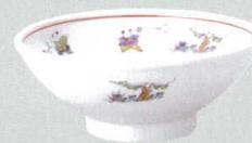
12-119-14-76197936 ¥2,500 新玉淵22cm井 22×8.9-1,480cc