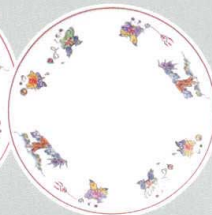
12-119-3-35080936 ¥1,500 メタ玉21cm皿 21×2.4