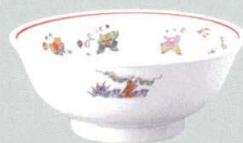
12-119-12-76194936 ¥2,100 反高台21cm井 20.3×8.4-1,250cc