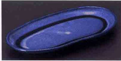
12902-41 900円 254112902 青海波まゆ型付出血 (213×105×20mm)