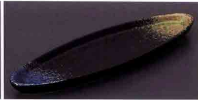
12903-06 900円 250612903 磯辺付出血 (255×78×18mm)