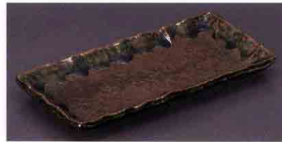
12916-32 760円 253212916 きらめき付出血 (206×104×18mm)