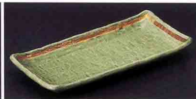
12906-41 850円 254112906 ヒワ測金付出血 (215×100×20mm)