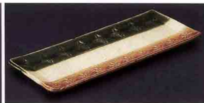
12909-16 800円 251612909 三袖印花付出血 (251×101×12mm)