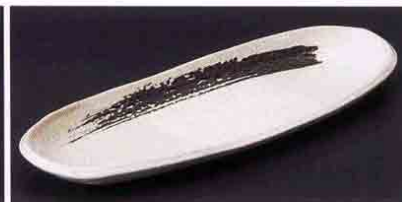
12912-33 800円 253312912 黒刷毛楕円付出血 (288×112×25mm)