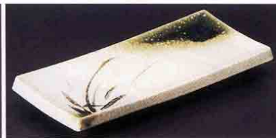
12911-05 800円 250512911 アジ付出血 (215×95×22mm)