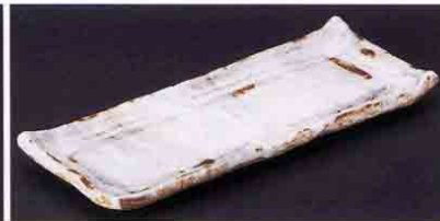
12914-32 760円 253212914 綿ぼうし付出血 (240×97×27mm)