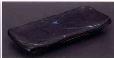
12908-15 840円 251512908 黒潮6.0付出血 (210×96×25mm)