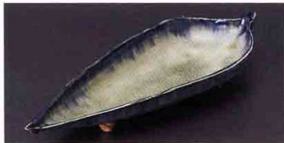
12904-40 900円 254012904 御深井葉型付出血 (270×105×48mm)