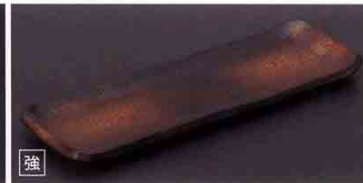
12918-41 750円 254112918 黒彩細付出血 (220×75×10mm)