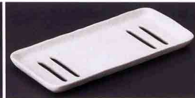
12915-40 760円 254012915 白ネタ皿 (215×100×15mm)