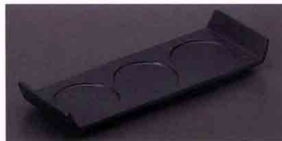
12910-02 800円 250112910 黒軸前菜皿 (260×94×28mm)