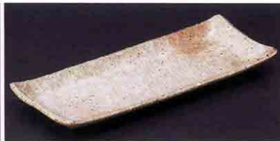
12905-10 850円 251012905 あけぼの付出血 (250×100×20mm)