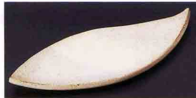
12913-22 800円 252212913 寿白結晶花びら29cm長皿 (216×290×13mm)