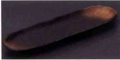
12901-07 900円 250712901 黒軸前菜皿 (274×82×22mm)