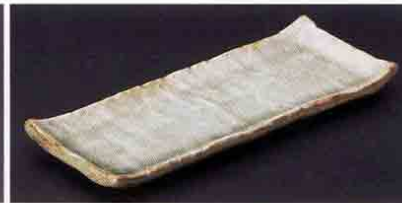
12917-15 760円 251512917 白雲付出血 (246×98×22mm)