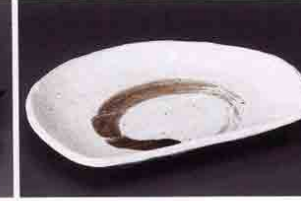
15126-26 650円 252615126 粉引うす潮半月皿 (227×165×25mm)