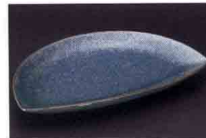
15117-03 550円 250315117 ブルーカイラギ半月銘々皿(180×115×22mm) 15118-03 850円 250315118 ブルーカイラギ半月皿(250×155×30mm)