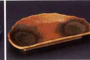
15129-25 420円 252515129 伊賀半月皿 (210×115×30mm)