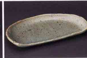
15119-05 600円 250515119 益子均窯半月焼物皿 (220×127mm)