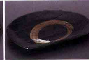
15123-26 650円 252615123 油滴つす潮半月皿 (227×165×25mm)