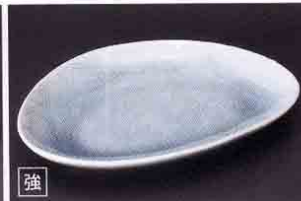
15106-31 2,200円 253115106 青白備前蛤型皿 (231×170×26mm)