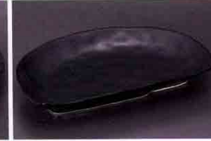
15124-16 440円 251615124 鉄結晶半月5.0皿(167×125×23mm) 15125-16 680円 251615125 鉄結晶半月7.0皿(226×140×29mm)