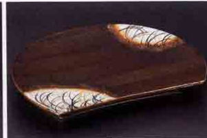
15107-08 2,100円 250815107 織野半月焼物皿 (215×152×28mm)