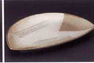
15114-25 400円 252515114 粉引くし目半月小皿(127×80×20mm) 15115-25 600円 252515115 粉引くし目半月鉢々皿(180×115×23mm) 15116-25 950円 252515116 粉引くし目半月多用皿(250×158×28mm)