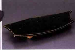
15103-08 2,800円 250815103 織部焼物皿 (255×110×48mm)