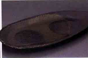
15102-43 2,650円 254315102 灰釉ホタモチ9.0変型皿 (270×140×20mm)