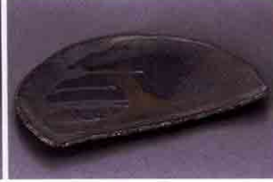
15104-43 2,860円 254315104 灰釉ホタモチ半月皿 (225×160×10mm)