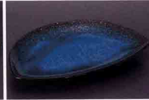
15113-02 1,000円 250215113 オーシャントルコ半月皿(大) (252×168×25mm)