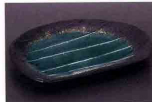
15110-05 890円 250515110 グリーン多用皿 (230×165×25mm)