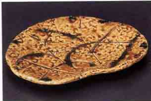
15101-08 4,000円 250815101 黄瀬戸おにぎり皿 (225×180×22mm)