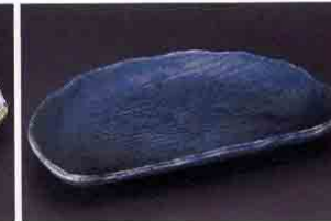
15128-41 420円 254115128 青オリハ半月焼物皿 (210×130mm)