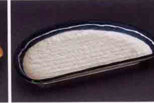
15130-47 420円 254715130 一珍珠ライン扇面皿 (210×125×23mm)