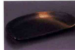
15122-30 600円 253015122 黒伊賀半月皿 (220×128×25mm)