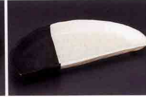
15121-20 750円 252015121 黒白塗りわけ布目半月皿 (243×128×25mm)