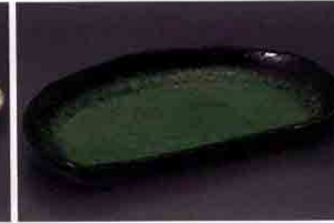
15120-08 750円 250815120 有明半月皿 (220×130mm)