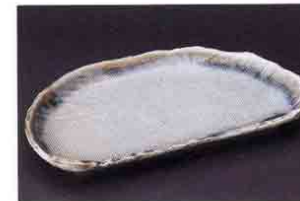
15127-41 650円 254115127 粉引ライン半月焼物皿 (240×140mm)