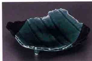
15105-18 2,050円 251815105 寄せ木交趾グリーン和皿 (200×178×45mm)