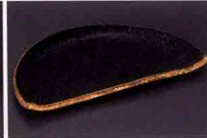
15108-45 1,500円 254515108 南蛮金彩7.0半月皿(210×125×20mm) 15109-45 2,000円 254515109 南蛮金彩8.0半月皿(245×145×20mm)