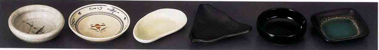
16637-12 265円 唐津スキ2.5皿 (85×85×35mm) 16639-26 270円 赤い花3.3深皿 (107×23mm) 16640-18 260円 ヒワ白磁豆型千代口 (115×70×15mm) 16641-02 260円 黒袖三角皿 (120×105×15mm) 16642-40 260円 天目2.5鉄鉢 (85×29mm) 16643-22 250円 深海グリーン角小皿 (91×91×18mm)