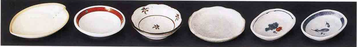
16619-27 320円 ビューピース木の葉小皿 (130×92×20mm) 16620-27 320円 赤巻水玉3.0皿 (95×23mm) 16621-16 330円 赤絵花3.0皿 (100×27mm) 16622-32 320円 夢太郎3.5丸皿 (108×16mm) 16623-27 300円 かぶ小判皿 (97×71×20mm) 16624-25 290円 野菜小判小皿ナス (98×72×19mm)