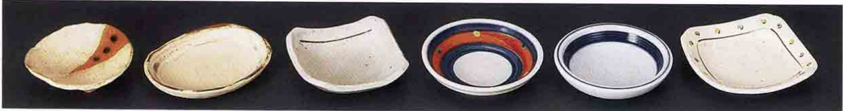
16613-02 350円 手造ヌリ分点紋三ツ足珍珠小皿 (84×76×26mm) 16614-32 340円 くりちよこ豆皿 (105×80×13mm) 16615-15 300円 唐津錆筋正角3.0皿 (87×87×24mm) 16616-26 340円 水玉赤錆3.0皿 (97×25mm) 16617-08 340円 3.0太筋皿 (95×20mm) 16618-27 330円 きらら角小皿 (95×95×20mm)