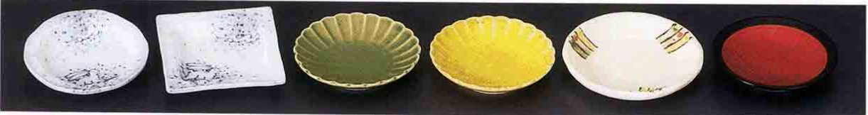
16631-37 290円 墨吹うさぎ丸皿 (97×17mm) 16632-37 290円 墨吹うさぎ角皿 (90×90×17mm) 16633-41 280円 菊形丸小皿 (ヒワ) (98mm) 16634-41 280円 菊形丸小皿 (黄) (98mm) 16635-15 280円 三色レインボー丸小皿 (104×17mm) 16636-03 280円 黒朱小皿 (97×18mm)