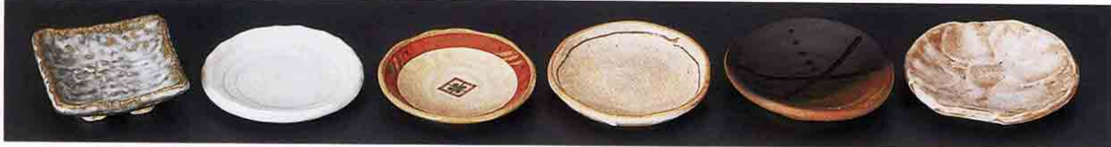
16601-15 370円 深山露正角千代口 (82×82×28mm) 16602-31 370円 やよい小皿 (97×16mm) 16603-27 360円 土物朱巻小皿 (95mm) 16604-32 360円 晴美3.0丸皿 (99×16mm) 16605-07 380円 焼玉3.0皿 (103×99×25mm) 16606-20 360円 梅志野小皿 (105×18mm)