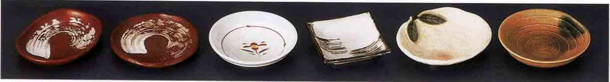
16625-31 300円 朱白刷毛精円豆皿 (105×80×16mm) 16626-31 290円 朱白刷毛小皿 (86×12mm) 16627-05 300円 赤絵小花3.0皿 (95mm) 16628-31 290円 ハケメ錆巻3.0浅口小皿 (79×79×19mm) 16629-25 280円 桜志野ゆず小皿 (110×96×25mm) 16630-33 280円 黄瀬戸一ツ押3.3皿 (100×95×20mm)