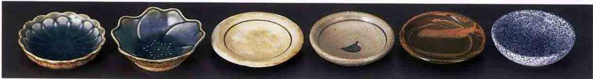
16607-16 360円 ヒスイ丸菊小皿 (96×20mm) 16608-16 360円 ヒスイ桜形小皿 (103×30mm) 16609-15 360円 初雪3.6丸小皿 (105×15mm) 16610-08 350円 土物筋点字3.0皿 (92×22mm) 16611-08 350円 織部小皿 (99×18mm) 16612-12 350円 スミ吹3.0皿 (92×92×28mm)