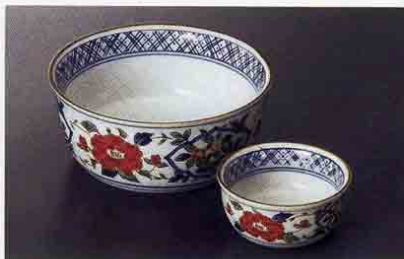
02203-18 1,600円 251802203 花唐草刺身鉢(140×60mm) 02204-18 560円 251802204 花唐草刺身千代口(80×37mm)