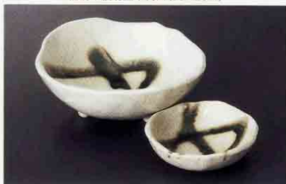
02213-13 930円 25102213 オリベ流し向付(140×50mm) 02214-13 480円 25102214 オリベ流し千代口(92×25mm)