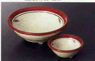
02215-16 880円 251602215 朱巻刺身鉢(160×55mm) 02216-16 380円 251602216 朱巻千代口(90×36mm)