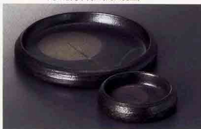
02207-28 1,600円 252802207 備前草紋切立5.5皿(170×20mm) 02208-28 800円 252802208 備前草紋切立千代口(90×20mm)