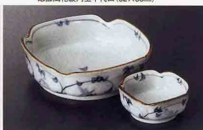
02211-31 1,070円 253102211 青磁唐草角刺身鉢(160×160×51mm) 02212-31 350円 253102212 青磁唐草角千代口(85×85×35mm)