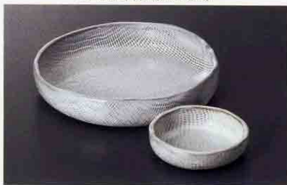
02219-12 800円 25102219 桃山志野手造り刺身鉢(155×155×25mm) 02220-12 370円 25102220 手造り丸千代口(85×85×22mm)