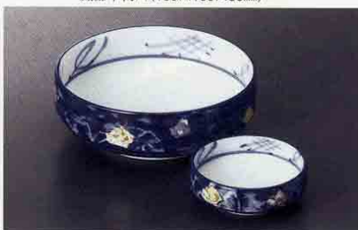
02227-31 710円 251102227 濃桔梗刺身鉢(133×45mm) 02228-31 350円 251102228 濃桔梗千代口(75×25mm)