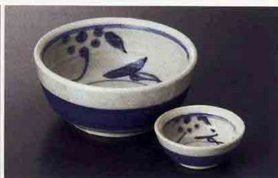
02205-08 1,600円 250802205 磁部風花紋内玉5.0刺身鉢(155×68mm) 02206-08 580円 250802206 磁部風花紋内玉千代口(82×33mm)