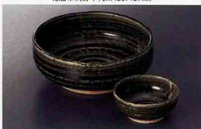
02209-28 1,300円 252802209 織部袖5.0鉢(160×60mm) 02210-28 440円 252802210 織部袖小付(82×35mm)