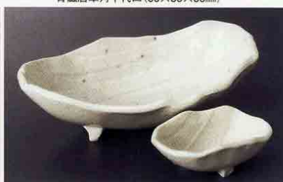
02217-02 800円 250202217 布目流水刺身鉢(204×120×60mm) 02218-02 260円 250202218 布目流水千代口(98×67×35mm)