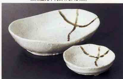
02229-07 380円 250702229 白一珍小判向付(175×122×40mm) 02230-07 200円 250702230 白一珍三ツ足千代口(90×25mm)