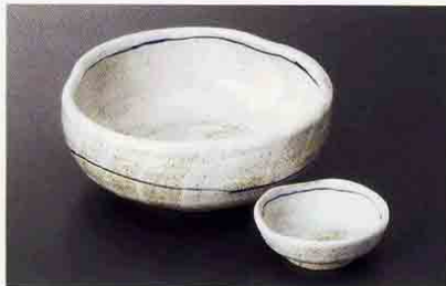
02201-31 1,650円 25102201 ゆきみち三ツ押刺身鉢(155×61mm) 02202-31 300円 25102202 ゆきみち丸千代口(76×33mm)