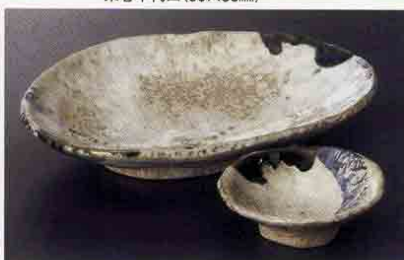
02221-35 800円 253502221 織部8.0刺身皿(240×170×40mm) 02222-35 280円 253502222 織部千代口(105×100×30mm)