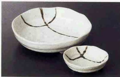
02225-05 680円 250902225 白一珍刺身皿(165×45mm) 02226-05 200円 250902226 白一珍刺身千代口(90×25mm)