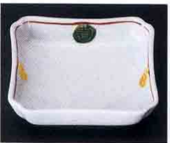
25723-30 740円 253025723 交趾福寿彫角浅鉢 (115×115×30mm)