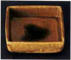
25703-45 1,900円 254525703 黄瀬戸角鉢 (115×115×33mm)