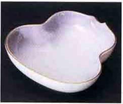
25727-13 760円 251325727 マロン吹ヒサコ型 (112×112×33mm)