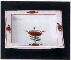
25708-40 1,000円 254025708 玉菊松華堂 (108×25mm)