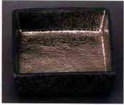
25702-45 1,650円 254525702 南蛮銀彩切立角鉢 (110×110×37mm)