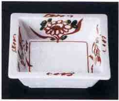
25707-40 1,100円 254025707 花鳥松華堂 (115×115×37mm)