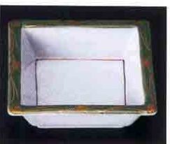
25710-12 900円 251225710 青むさしの角鉢 (113×35mm)