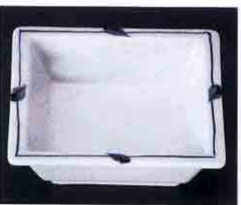
25719-12 640円 251225719 コス笹松華堂角鉢 (115×115×35mm)