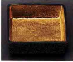
25701-45 1,650円 254525701 南蛮金彩切立角鉢 (110×110×37mm)