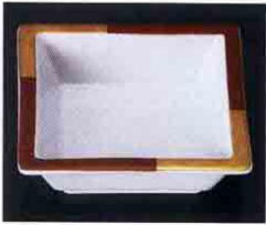
25721-40 750円 254025721 朱金測松花堂(大) (115×115×37mm)