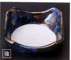
25705-32 1,500円 253225705 金彩輪花松華堂 (110×110×44mm)