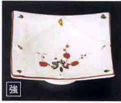
25706-31 1,250円 253125706 赤松喜ひ松花堂 (110×110×38mm)