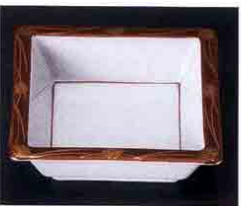
25709-12 900円 251225709 赤むさしの角鉢 (113×35mm)