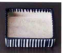
25730-15 450円 251525730 十草4.0切立角皿 (100×100×25mm)