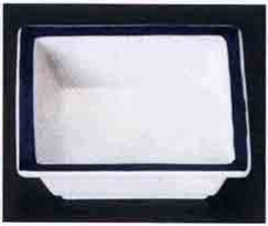
25717-18 700円 251825717 測紺角鉢 (115×36mm)