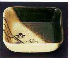
25729-25 480円 252525729 織部角小鉢 (110×112×35mm)