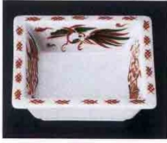
25711-12 850円 251225711 錦花鳥松華堂角鉢 (115×115×35mm)