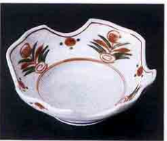
25728-30 800円 253025728 万層四方切角鉢 (105×43mm)