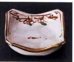
25715-03 850円 250325715 赤絵万層四角松花堂 (110×110×38mm)