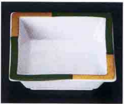
25722-40 750円 254025722 緑金測松花堂(大) (115×115×37mm)