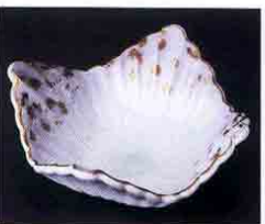
25724-16 820円 251625724 金たたき菊型小鉢 (106×106×47mm)