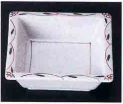
25713-12 850円 251225713 錦山茶花角鉢 (113×35mm)