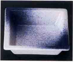
25726-23 550円 252225726 吹墨正角鉢 (113×113×33mm)