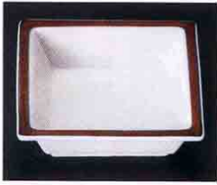
25716-18 820円 251825716 測赤角鉢 (115×36mm)