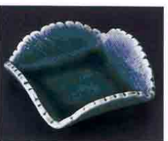
25725-18 620円 251825725 織部調角鉢 (115×115×35mm)