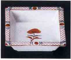
25712-12 850円 251225712 錦菊角鉢 (115×115×35mm)