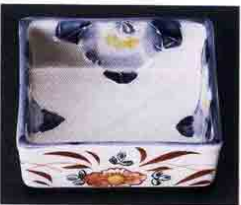
25704-31 1,200円 253125704 赤画山茶花四角小鉢 (114×114×39mm)