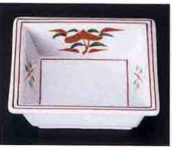
25714-25 850円 252525714 赤花四角鉢 (113×35mm)