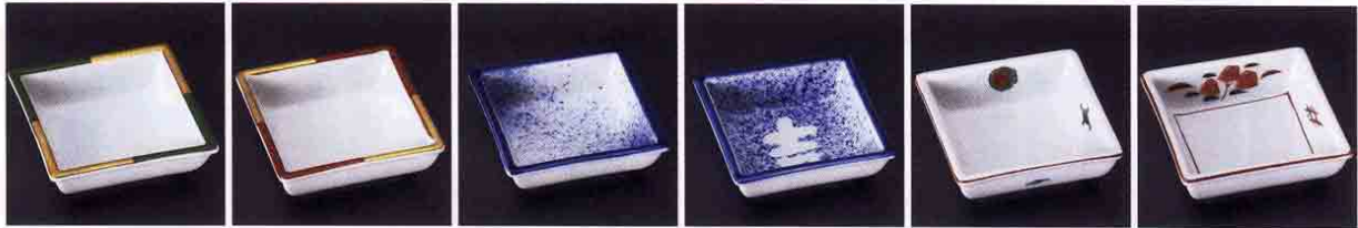
26105-40 650円 254026105 緑金湖松花堂(小) (95×95×30mm)