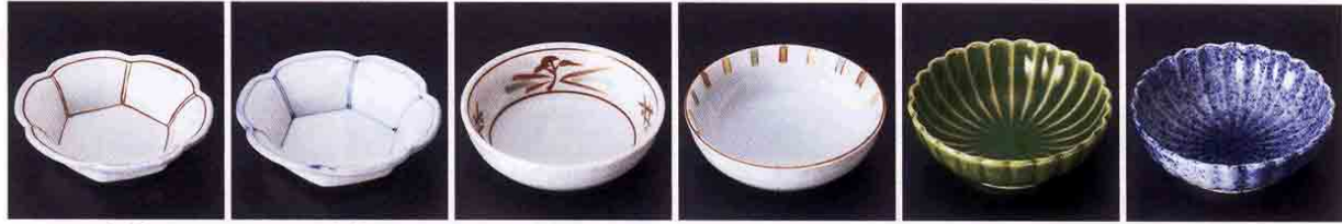
26123-08 800円 250826123 赤筋入六ツ山小鉢 (110×320mm)