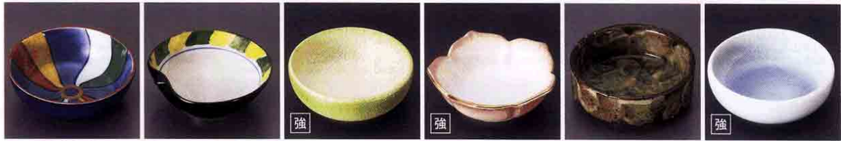
26111-13 1,050円 251326111 紙風船鉢 (105×35mm)