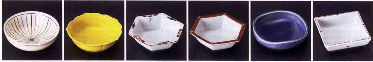
26117-13 930円 251326117 手巾小鉢 (105×35mm)