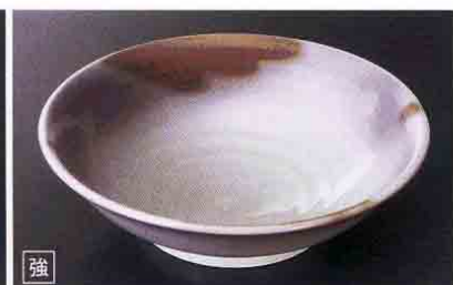
03215-30 1,000円 253003215 紅雲平向付(157×40mm)