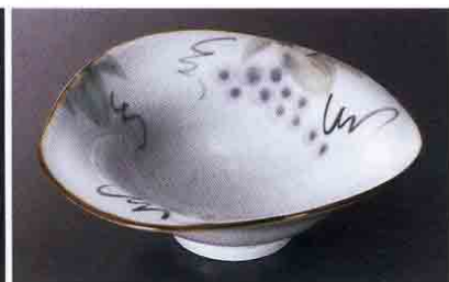
03212-18 1,150円 351803212 手書きぶどうなぶり向付(156×152×53mm)