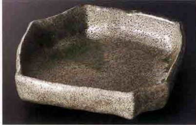
03201-18 2,000円 351803201 かいらぎ六角向付(170×167×48mm)