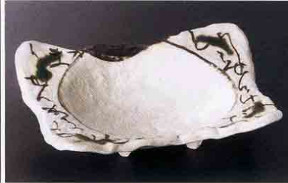
03202-07 1,500円 350703202 志野文字角向付(160×144×47mm)