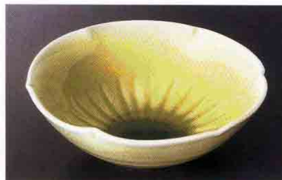
03213-30 1,100円 253003213 ひわ袖花型花彫向付(152×53mm)