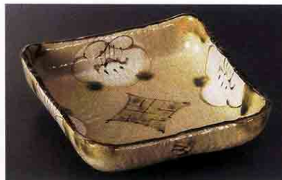
03210-07 1,150円 250703210 志野織部格子正角4.5取鉢(136×32mm)