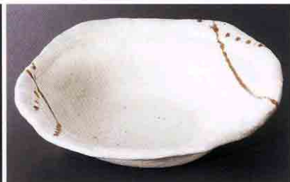
03206-28 1,800円 352803206 辰砂ちらし平皿(手起)(185×50mm)