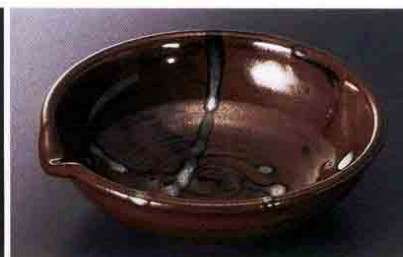
03214-41 1,000円 254103214 鉄釉片口5.0鉢(150×45mm)