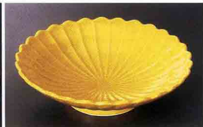
03209-18 1,300円 251803209 黄磁菊型5.3皿(162×40mm)