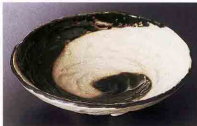
03204-30 1,850円 253003204 織部口クロ目5.5深皿(172×45mm)