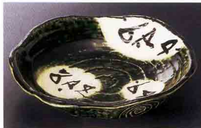
03207-30 1,300円 253003207 織部錆絵向付(173×166×40mm)