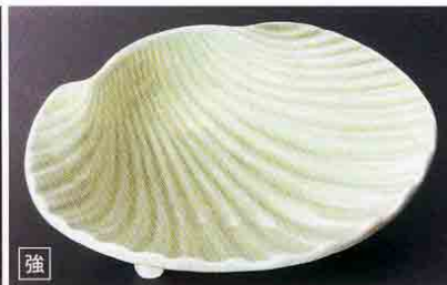
03205-41 1,800円 254103205 ヒワ貝型向付(175×140×35mm)