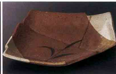
03208-15 1,300円 251503208 浏唐津掛芦ムスビ形6.0皿(213×155×28mm)