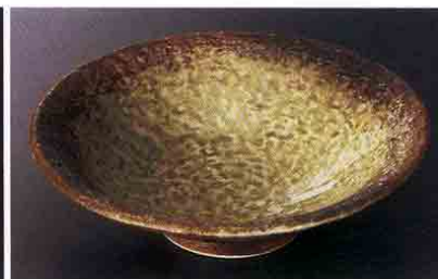
03211-18 1,150円 251803211 信楽吹5.5平鉢(170×48mm)