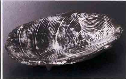
03203-28 1,300円 350803203 炭火土白化粧6.5小判皿(190×125mm)