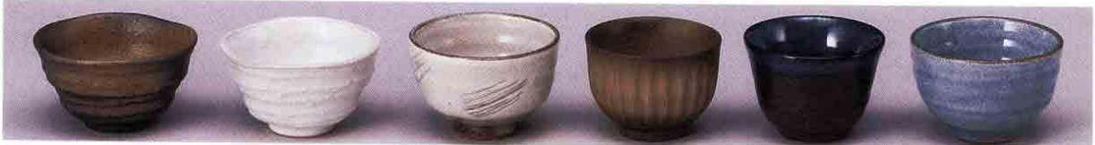
32031-27 320円 25272031 黒備前変形煎茶 (93×51mm) 32032-47 250円 25472032 粉引千茶 (94×50mm) 32033-25 350円 25252033 粉引かきとり煎茶 (88×58mm) 32034-26 240円 25162034 風流ソギ千茶 (80×58mm) 32035-03 300円 25032035 黒結晶ナマコ反煎茶 (82×59mm) 32036-03 290円 25032036 ブルーカイラギ千茶 (90×58mm)