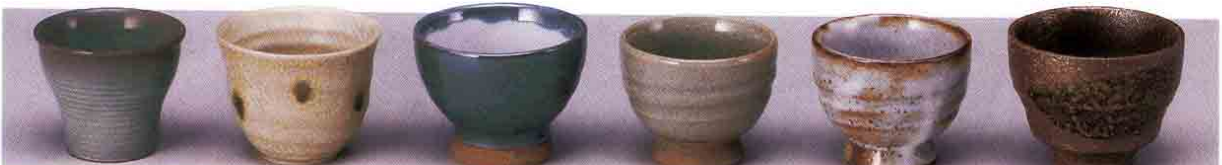
32037-26 240円 25262037 グリーン袖反千茶 (75×63mm) 32038-26 260円 25262038 マット水玉反千茶 (80×65mm) 32039-12 480円 25122039 グリーン厚口高台煎茶 (88×67mm) 32040-16 340円 25162040 ヒワ貴人千茶 (78×63mm) 32041-16 340円 25162041 ネズミ高台千茶 (78×64mm) 32042-20 260円 25202042 栗伊賀煎茶 (86×68mm)