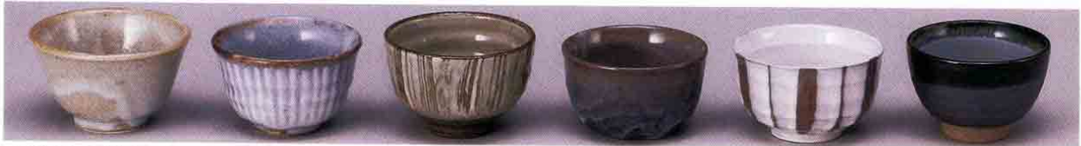
32025-28 400円 25282025 白唐津厚口煎茶 (93×55mm) 32026-20 480円 25262026 千十草ねずみ志野煎茶 (88×55mm) 32027-27 320円 25272027 土物刷毛煎茶 (88×57mm) 32028-05 300円 25052028 茶裂地煎茶 (83×50mm) 32029-16 300円 25162029 十草千茶 (86×51mm) 32030-33 380円 25332030 サビ巻煎茶 (83×56mm)