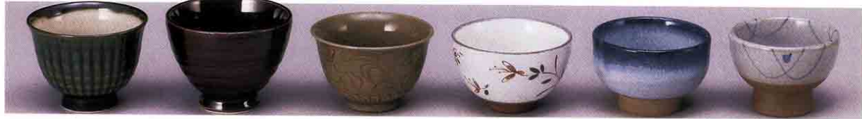
32001-31 650円 25312001 織部ソキ高台千茶 (90×88mm) 32002-28 640円 25282002 ア×袖高台煎茶 (93×72mm) 32003-33 600円 25332003 草花彫反千茶 (92×60mm) 32004-02 610円 250222004 粉引赤絵小花煎茶 (92×56mm) 32005-07 520円 250722005 青雲高台千茶 (87×55mm) 32006-28 500円 25282006 青唐津高台煎茶 (83×60mm)