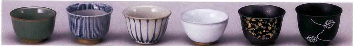
32019-27 560円 25272019 ヨモギ十草千茶 (85×52mm) 32020-15 580円 25152020 さみだれ千茶 (86×60mm) 32021-05 480円 25052021 コス十草煎茶 (88×60mm) 32022-20 470円 25202022 白袖煎茶 (88×52mm) 32023-38 420円 25062023 金銀彩煎茶 (85×60mm) 32024-02 520円 25022024 手彫木の葉煎茶 (85×64mm)