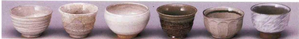
32007-06 600円 25062007 美濃はぎ線彫煎茶 (91×54mm) 32008-07 560円 25072008 美濃萩煎茶(小) (84×60mm) 32009-07 580円 25072009 白粉引汲出 (97×63mm) 32010-03 530円 25032010 ヒワ灰袖反煎茶 (86×58mm) 32011-28 520円 25282011 天竜流ソキ煎茶 (90×55mm) 32012-05 520円 25052012 白粉引煎茶 (83×62mm)