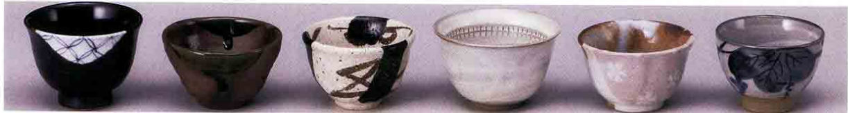
32013-32 560円 25322013 黒次郎高浜千茶 (91×66mm) 32014-15 560円 25152014 伊賀風オリベ掛千茶 (93×55mm) 32015-20 490円 25202015 太筆土物手書き千茶(厚口) (87×58mm・150cc) 32016-40 430円 25402016 京唐津結千茶 (97×62mm) 32017-06 440円 25062017 志野春秋千茶 (90×55mm) 32018-47 560円 25472018 粉引巻ぶどう千茶 (84×57mm)