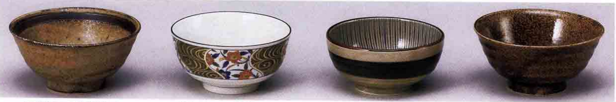
36030-08 590円 250836030 グレーマツ多用丼 (179×85mm)