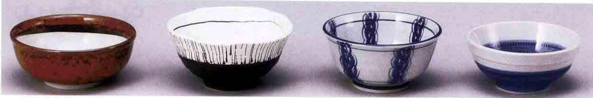
36001-33 1,150円 253336001 摩張朱赤6.0丼 (180×76mm) 36002-33 1,900円 253336002 摩張朱赤7.0丼 (215×86mm)