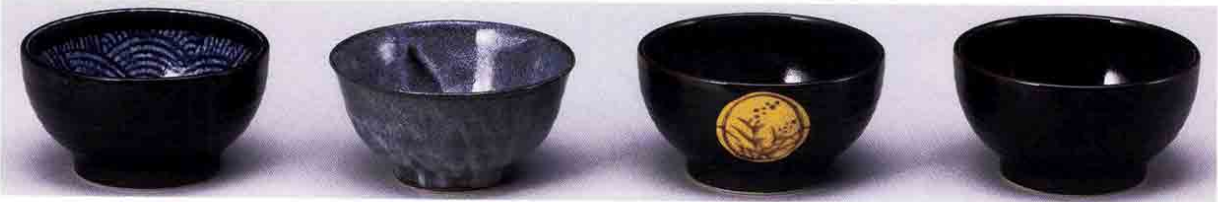
36022-47 750円 254736022 青海波5.5釜あげ丼 (170×90mm)