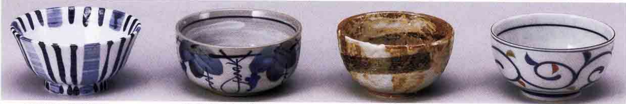
36009-30 1,100円 253036009 呉須十草5.0反種丼 (160×80mm) 36010-30 1,300円 253036010 呉須十草5.5反種丼 (172×90mm)