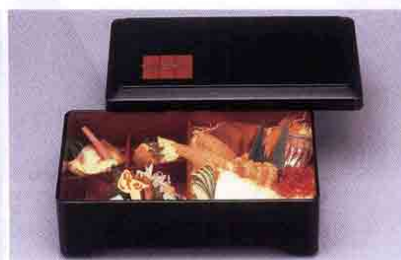
59112-56 2,750円 255659112 A 錦弁当黒千筋若竹 (仕切付) (260×163×75mm)