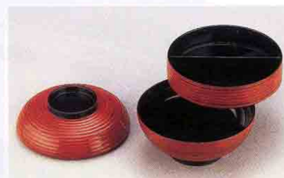
59117-56 4,200円 255659117 A ちょうちん弁当朱 (166×150mm)