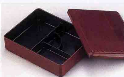
59106-56 1,700円 255659106 A 8寸長手固定弁当溜 (243×190×59mm)