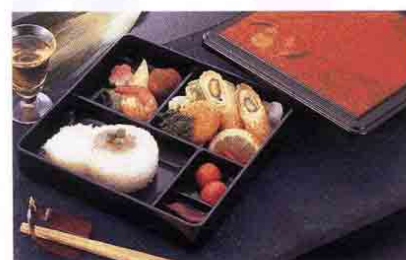
59110-56 1,800円 255659110 A 7寸角葵弁当朱パールなす (205×205×49mm)