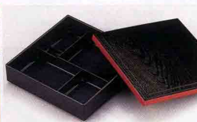
59105-56 1,350円 255659105 A 7寸角固定松花堂黒木目朱 (225×225×60mm)