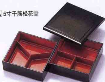
59113-56 1,600円 255659113 A 5寸千筋松花堂内朱 (仕切付) (155×155×54mm) 59114-56 2,550円 255659114 A 5寸千筋松花堂内朱 (仕切付) (155×155×100mm) 59115-56 650円 255659115 A T仕切朱 59116-56 650円 255659116 A Y仕切朱