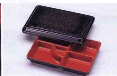
59111-56 1,700円 255659111 A 8寸長手富士弁当黒木目内朱 (225×184×54mm)