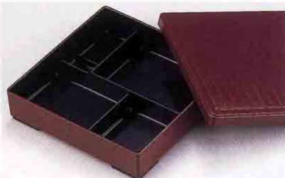
59103-56 1,650円 255659103 A ニュー8寸角固定弁当マルーン (242×242×63mm)