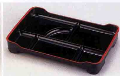
59118-56 2,000円 255659118 A 定食プレート黒天朱 (356×237×51mm)