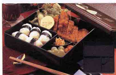
59104-56 2,000円 255659104 A 8寸トンカツ弁当梨地はまぐり (245×245×60mm)