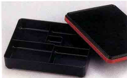
59101-56 1,750円 255659101 A 8.5寸長手舞子弁当黒千筋朱 (255×203×62mm)