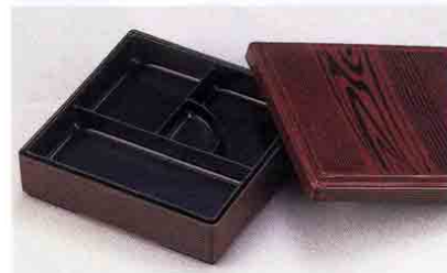
59107-56 1,800円 255659107 A 7寸角弁当木目 (210×210×55mm)