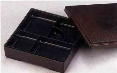
59102-56 1,850円 255659102 A 8寸角別仕切千筋弁当金梨地 (245×245×60mm)