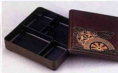
59109-56 2,100円 255659109 A 7.5寸角弁当梨地御所車 (226×226×53mm)